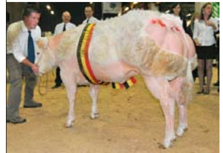
Impatiale de Fooz (v. Orme), nationaal kampioene vaarzen