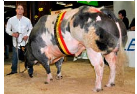
Nestlé de St. Fontaine (v. Etna), nationaal kampioen stieren

Ook in de categorie stieren was er bij de jury weinig coherentie over het type. Het fraaie, moderne model van de kam-