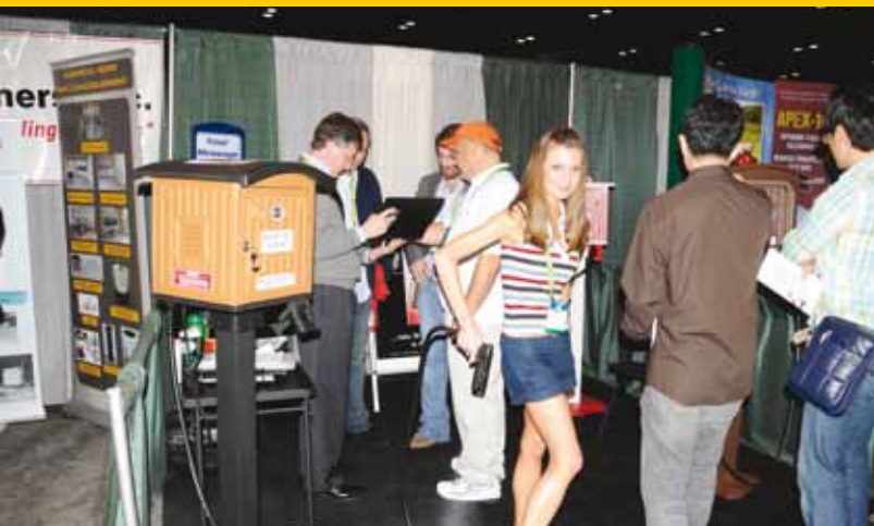
Zonnebrand olie vending machine