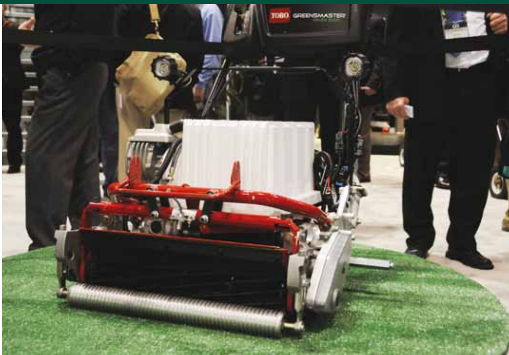
Toro elektrische handgreenmaaier

Deze tegenvallende cijfers vormden voor de 'big players' van de golfindustrie geen belemmering om stevig uit te pakken voor de golfshow van 2011. Het meest interessante nieuws kwam daarbij traditioneel van de drie grote maaierfabrikanten: Jacobsen, John Deere en Toro. Werd de agenda daarbij in 2009 hoofdzakelijk bepaald door John Deere met de introductie van een complete lijn hybrides en Jacobsen in 2010 met de officiële introductie van de Jacobsen Eclips. Dit jaar was het beurt aan Toro om de agenda te bepalen .... en –heel verassend- ook met een hybride te komen. Maar marktleider Toro zou geen marktleider zijn als dat laatste niet met de nodige arrogantie gebracht zou worden. Een woordvoerder op de Toro stand bracht het als volgt: Vvoor onze concurrenten is hybride vooral een middel om oliekkages te minimaliseren. Dat is voor ons geen item. Gewoon omdat we daar geen last van hebben."