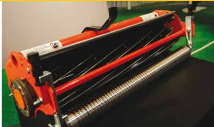
Jacobsen 15 blade reel 15 messen kooi.