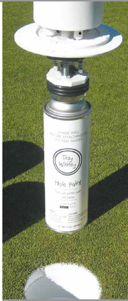
Verf om holes te spuiten

Grappig en misschien ook wel levensvatbaar was een magnetische ballmark repair kit. Dit apparaat