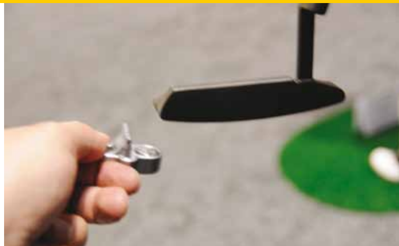
Magnetic ballmark control