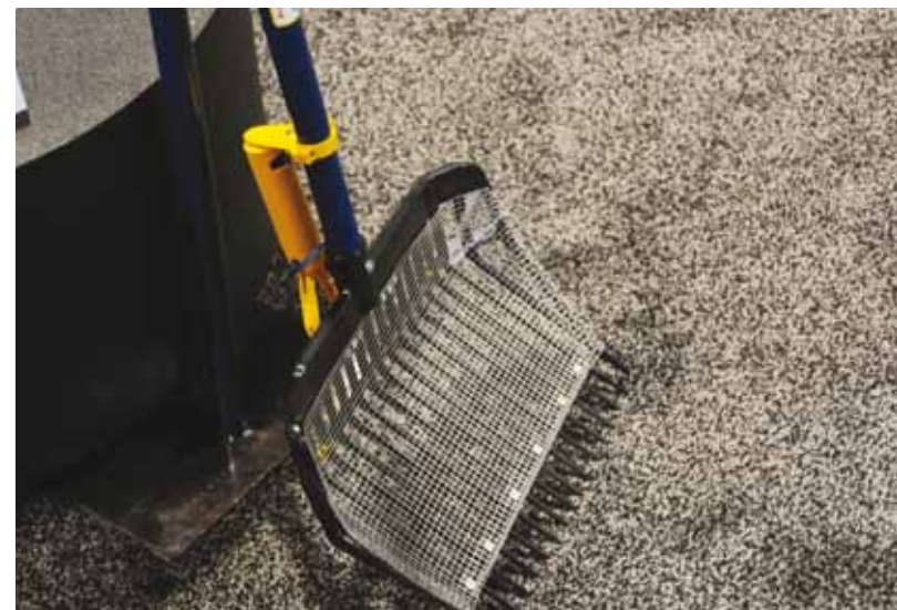
Motor driven bunkerhark