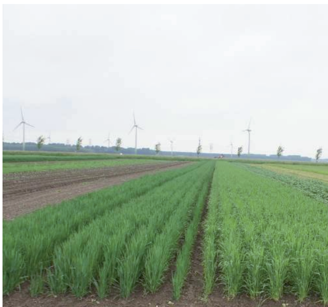
Proefveld Stabiliteit door diversiteit in 2010

Het ontwikkelen van een stabiel en robuust landbouwsysteem dat minder gevoelig is voor externe factoren zoals ziekten, plagen, weersinvloeden en klimaatveranderingen. De biologische landbouw heeft immers weinig andere mogelijkheden dan het verhogen van de (bio)diversiteit om de weerbaarheid van het landbouwsysteem te verhogen.