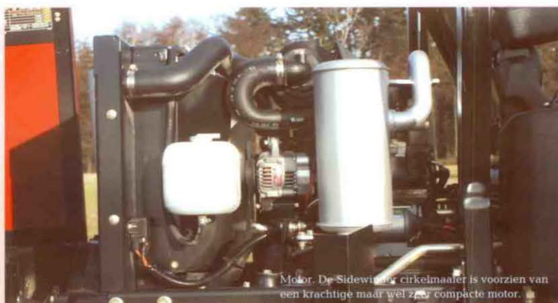
Motor. De Sidewinder cirkelmaaier is voorzien van een krachtige maar wel zeer compacte motor.

Deze rubriek in Man & Machine is bedoeld om de ervaringen van greenkeepers met specifieke machines te ventileren en daar is in dit verhaal nog weinig van terechtgekomen. Terwijl de mannen en een vrouw van 'De Lage Vuursche' toch al anderhalf jaar ervaring hebben