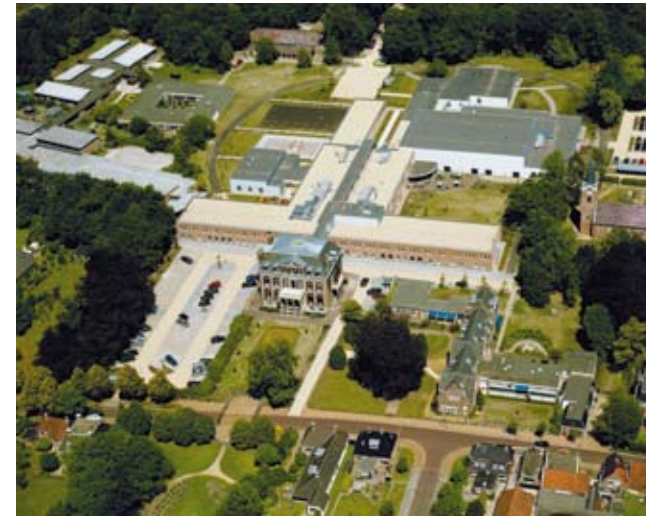
Revalidatie Friesland en School Lyndensteyn

School Lyndensteyn is een een mytyl-/tyltylschool voor speciaal en voortgezet speciaal onderwijs. De leerlingen zijn lichamelijk of meervoudig gehandicapt of langdurig ziek.