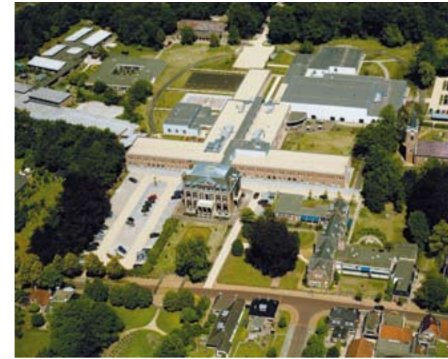
Revalidatie Friesland en School Lyndensteyn

School Lyndensteyn is een een mytyl-/tyltylschool voor speciaal en voortgezet speciaal onderwijs. De leerlingen zijn lichamelijk of meervoudig gehandicapt of langdurig ziek.