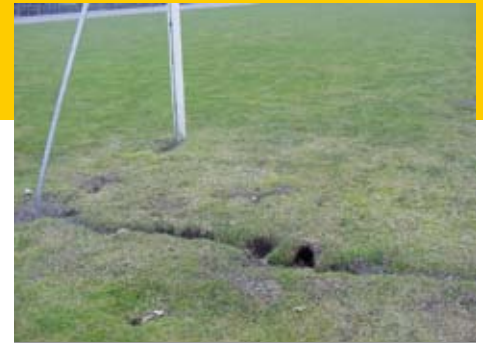
Echt fanatiek supporters: het thuisfront heeft de loopgraven achter het doel bij na klaar.

en konijnen vinden de bodemopbouw van een kunstgrasveld buitengewoon aantrekkelijk om in te graven. Je krijgt verzakkingen waardoor je hele kunststofvelden moet opensnijden. En dat is behoorlijk ingrijpend. Aannemers zouden tijdens de aanleg moeten denken over het preventief ingraven van een niet zichtbaar doek: Naast antiworteldoek dus een gaas of doek aanbrengen dat knaagdieren en mollen weert."