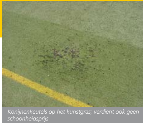
Konijnenkeutels op het kunstgras; verdient ook geen schoonheidsprijs