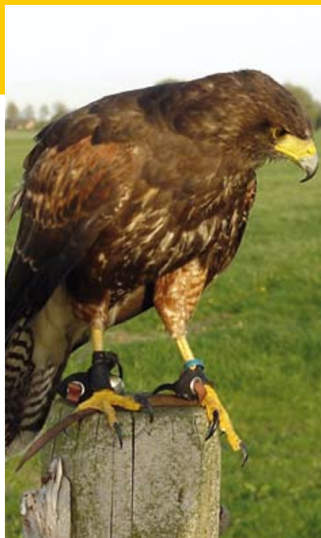
Konijnenpopulatie beheren met behulp van roofvogels