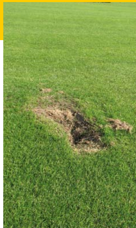
Gevaarlijke konijnencup op een fairway wat zeggen de regels wanneer de golfbal daarin belandt?