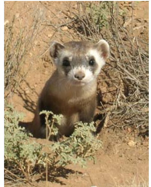
Fretten verdrijven konijnen uit de holen.

Zo had ook de Brabantse gemeente Haaren dit voorjaar veel overlast van konijnen. Een pas