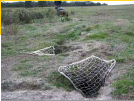
Bij fretteren kun je de konijnen ook vangen en elders uitzetten