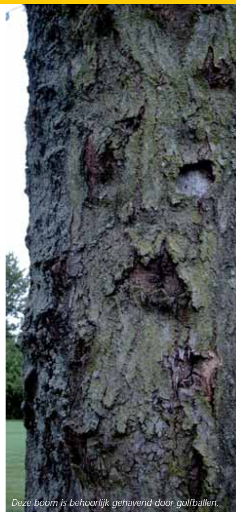
Deze boom is behoorlijk gehavend door golfballen.