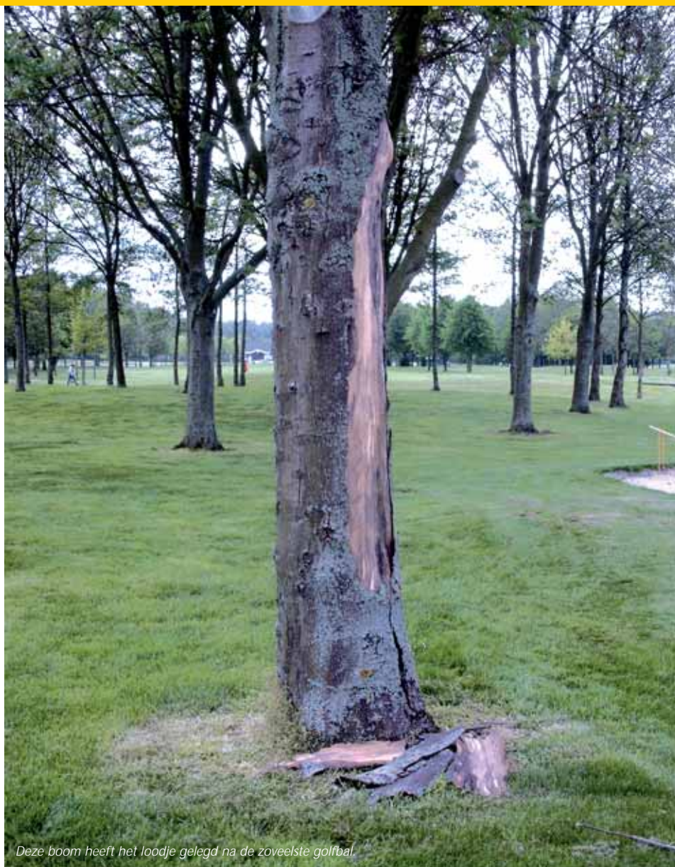
Deze boom heeft het loodje gelegd na de zoveelste golfbal.