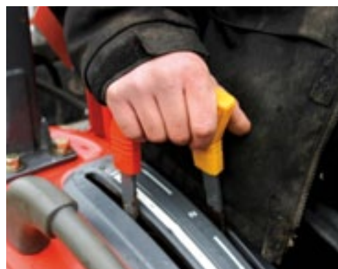
Met de rode hendel bedien je de hef. Met de gele het dubbelwerkende ventiel.