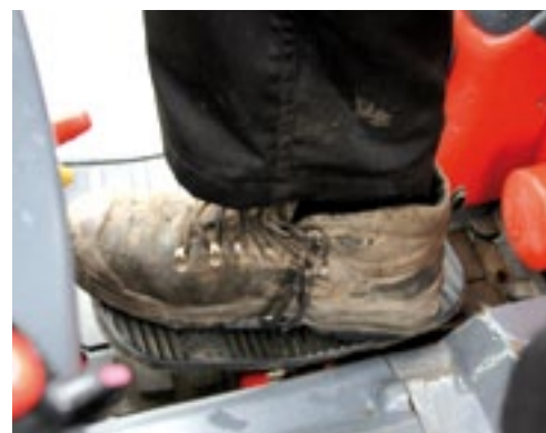
Met het rijpedaal kies je de rijrichting en bepaal je de rijnsnelheid.