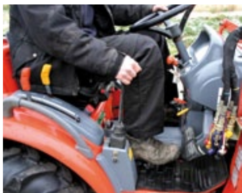
De kruishendel wordt standaard gemonteerd en bedient op deze trekker de voorlader.

Standaard is de CK22 voorzien van een driepuntheffinrichting (categorie I) met een maximaal hefvermogen van 503 kg op een afstand van 60 cm achter de kogels. De topstang kun je in drie standen in hoogte verstellen. Beide hefarmen hebben stabilisatiekettingen. ■