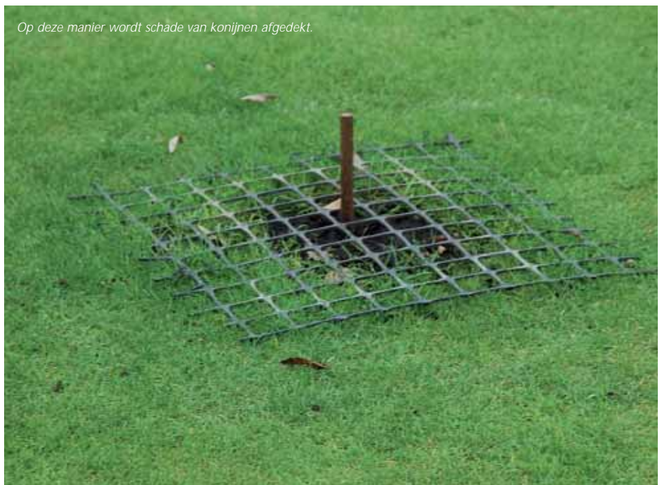
Op deze manier wordt schade van konijnen afgedekt.

De Old Course is de eerste golfbaan waar Thomasse proeven neemt. Daarvoor heeft hij zijn korrels al uitgebreid getest op de luchthavens Schiphol en Zaventem. Daar veroorzaken geen konijnen, maar muizen overlast. Veel muizen in de grasvelden naast de startbaan betekent veel predatie door valken en andere roofvogels. En dat is weer gevaarlijk voor startende en landende vliegtuigen. Iedere vogel die wordt opgeslokt door een vliegtuigturbine betekent een schadepost van minimaal 110.000 dollar. Nog afgezien van extra kosten voor oplopende wachttijden.