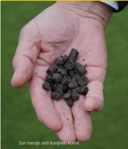
Een handje anti konijnen korrel.