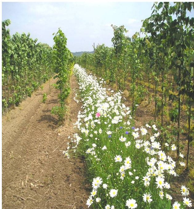
Het gebruik bloemstroken op de kwekerij stimuleert natuurlijke vijanden waarmee plagen op natuurlijke wijze worden teruggedrongen.

In de milieurapportage boomkwekerij en de vaste plantenteelt wordt voor de hele sector het verbruik aan gewasbeschermingsmiddelen in kg actieve stof en de daarbij behorende milieubelasting vastgesteld. Om de milieubelasting zo goed mogelijk te berekenen is gebruik gemaakt van de verbruikcijfers zoals die in opdracht van het Productschap Tuinbouw zijn verzameld. PPO koppelde deze gegevens aan de milieumeetlat van het Centrum voor Landbouw en Milieu. Op basis hiervan blijkt dat de milieubelasting in boom- en vaste plantenteelt in 2008 maar liefst met 84% gedaald is ten opzichte van 1998, het referentiejaar. Dat is een prima resultaat, maar er is nog een laatste inspanning nodig om de convenantsdoelstelling van 95% in 2010 te behalen.