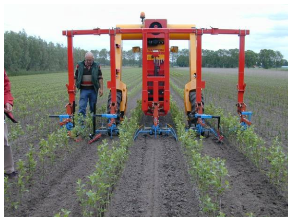
De afgelopen jaren zijn veel verbeteringen bereikt in de mechanische onkruidbestrijding; hier een demonstratie op een vruchtboomkwekerij met een gewasgeleideschoffel in combinatie met vingerwieders.

Om het effect van gerichte maatregelen te kunnen bepalen én verantwoorden, is het noodzakelijk een betrouwbare relatie tussen de gemeten concentraties en de verantwoordelijke toepassingen en emissieroutes te kunnen leggen. Dit vindt voor een aantal stoffen momenteel plaats in de ontwikkeling van een protocol ('Methodiek interpretatie monitoringsresultaten en oorzakenanalyse'). Deze studie is gericht op alle sectoren. Afhankelijk van het type stof kan dit ook betrekking hebben op de boomkwekerijsector. Daarnaast verdient het aanbeveling dat het aantal meetnetten bij de waterbeheerders uitgebreid wordt waardoor het overzicht van gevonden concentraties in het oppervlaktewater betrouwbaarder wordt.