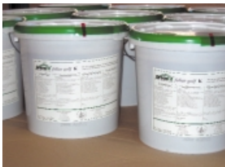
GreenFit® - Liquid Fertilizer