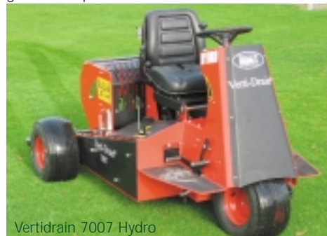
Vertidrain 7007 Hydro

De Vertidrain 7110 is een snelle kleine Vertidrain met een werkbreedte van 99 cm, passend op tractoren van 14-15 pk. Deze Vertidrain penetreert tot 150 mm diep, en de pinnen kunnen zowel verticaal als in de "wrik" positie worden gebracht. De 7110 is een eenvoudige Vertidrain versie met een enkele versnelling, en het weegt daardoor veel minder (ongeveer 250 kg). De 7110 heeft standaard geen voorroller. De machine zal naar verwachting vooral ingezet gaan worden op kleine 9 holes golfbanen, maar ook op campings. Een toepassing waar veel van verwacht wordt is de combinatie van een cirkelmaaier, die onder de tractor is gemonteerd. Terwijl achterop de Vertidrain 7110 is aangebracht. Op zo'n manier kunnen twee bewer-