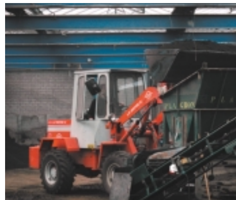
Productiehal bij Plagron

Additionele Golfalgin verbetert de capaciteit van de grond om zichzelf te verversen voor cat ionen. Het plaatst een bufferzone tegen hoge zoutcon-