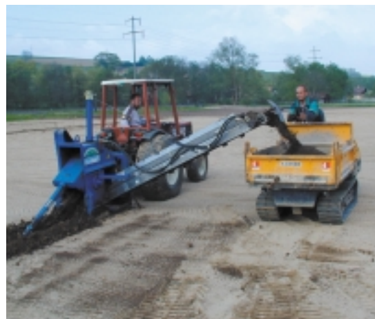
Lingener Baumaschinen sleuvengraver

Alle machines van de Grabenmeister serie zijn standaard uitgerust met een korte hydraulische aangedreven band, die de grond links of rechts van de machine afvoert. Optioneel kunnen de gravers worden uitgerust met een lange hydraulische aangedreven band die de grond direct in een trailer, die los van de machine staat, deponert. Vanwege deze mogelijkheid kan de sleuvengraver erg "schoon" werken op alle soorten sportvelden en golfbanen, zonder dat iemand achter de machine hoeft te lopen om al de overtollige grond op te ruimen. Alle Grabenmeister kettinggravers zijn beweegbaar door een "power take-off drive" of, optioneel, hydraulisch. De "power take-off drive" creëert een maximale kracht op de tractor voor het graven van gleuven. Er gaat geen kracht verloren door pompen of hydraulische motoren. Zeer belangrijk voor alle tractoren is een "creep-speed" systeem, voor een werksnelheid van 0 – 200 meter per uur. Behalve een uitvoering