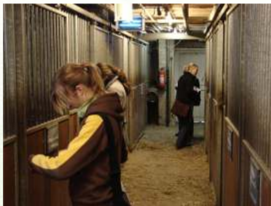
Figuur 1: Studenten in actie tijdens eindtest module "animal": audit van een manege