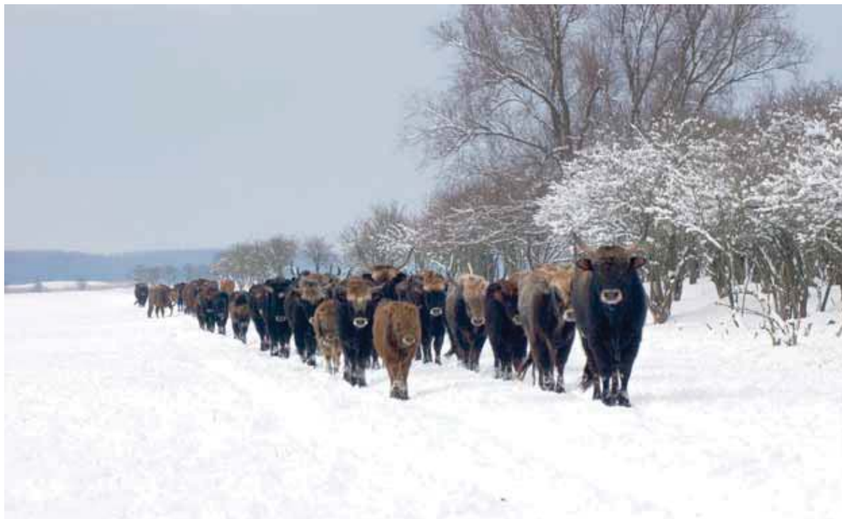
Heckrunderen in de Oostvaardersplassen.

ten van ondervoede dieren in een eerder stadium is een handreiking aan het maatschappelijk debat. Maar er zitten wel nadelen aan. Het doodschieten op basis van een conditiescore is sowieso arbitrair. We hebben wel eens hele slechte dieren laten lopen en zagen dan toch een wonderbaarlijk herstel. Door nu de dieren eerder te gaan schieten wordt dit hele selectiesysteem van ‘wie gaat wel dood en wie niet?’ nog willekeuriger. We gaan zo toch meer toe naar een systeem van klassieke regulatie door de jacht. Het is onontkoombaar dat de selectie minder goed wordt en je dieren zult gaan schieten die het wellicht gehaald zouden hebben.’