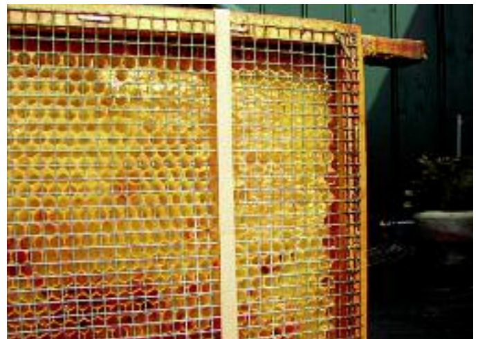
Draadgaas geeft beter zicht maar pas op met de lassen