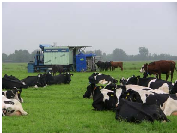
Mobilele melkrobot op Zegveld