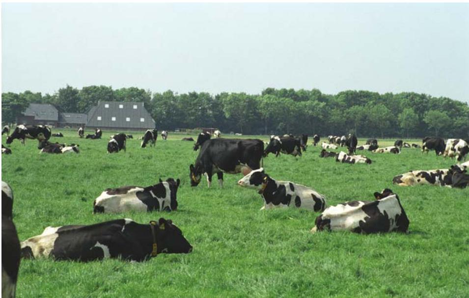
Veel beweiden is aantrekkelijk voor boer en landschap

De kostprijs per 100 kg melk kan verlaagd worden door optimalisatie, schaalvergroting, meer beweiden en een voercentrum. Extra grond is bij de gehanteerde prijzen niet rendabel.