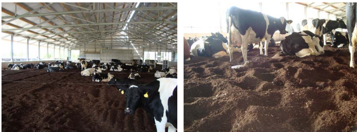
Vrijloopstal met bodem van gecomposteerde houtsnippers

De vrijloopstal is een stal zonder ligboxen en een zachte bodem met veel ruimte per koe. De koeien lopen en liggen op een bodem dat uit verschillend materiaal kan bestaan zoals compost of houtsnippers. Compost is gecomposteerd materiaal van een composteringsbedrijf. Dit kan plantaardig snoeiafval zijn dat uitgecomposteerd is. In de stal dient het als buffer om de urine van koeien op te vangen. De toplaag moet kunnen drogen door geïnstalleerde ventilatoren. Door houtsnippers te gebruiken en de bodem extra te beluchten wordt samen met de mest van koeien 'compost verrijkt met mest' gemaakt. Deze bodem noemen we een composteringsbodem, omdat er 'compost' in de stal wordt gemaakt met mest van koeien samen met houtsnippers. Het materiaal heeft echter niet de status van compost maar van mest. De warmte die in de bodem ontstaat door compostering zorgt voor extra verdamping van het vocht. Hierdoor kan met minder m 2 per koe ten opzichte van een 'compostbodem' toch een droge toplaag verkregen worden. Voor de Noord Friese Wouden is een composteringsbodem met houtsnippers als basismateriaal een interessante optie, omdat er veel materiaal in het gebied aanwezig is. De houtwallen en elzensingels kunnen hiermee een nieuwe economische functie krijgen. Namelijk als bodem in een vrijloopstal en het creëren van mest met veel organische stof wat bovengronds aangewend kan worden en de bodemvruchtbaarheid kan verbeteren.