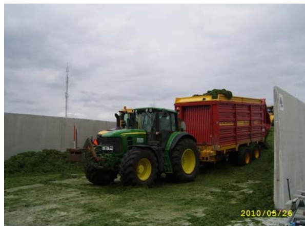
Centrale opslag van voer op voercentrum. Transport met vrachtwagens of trekkers met wagen.