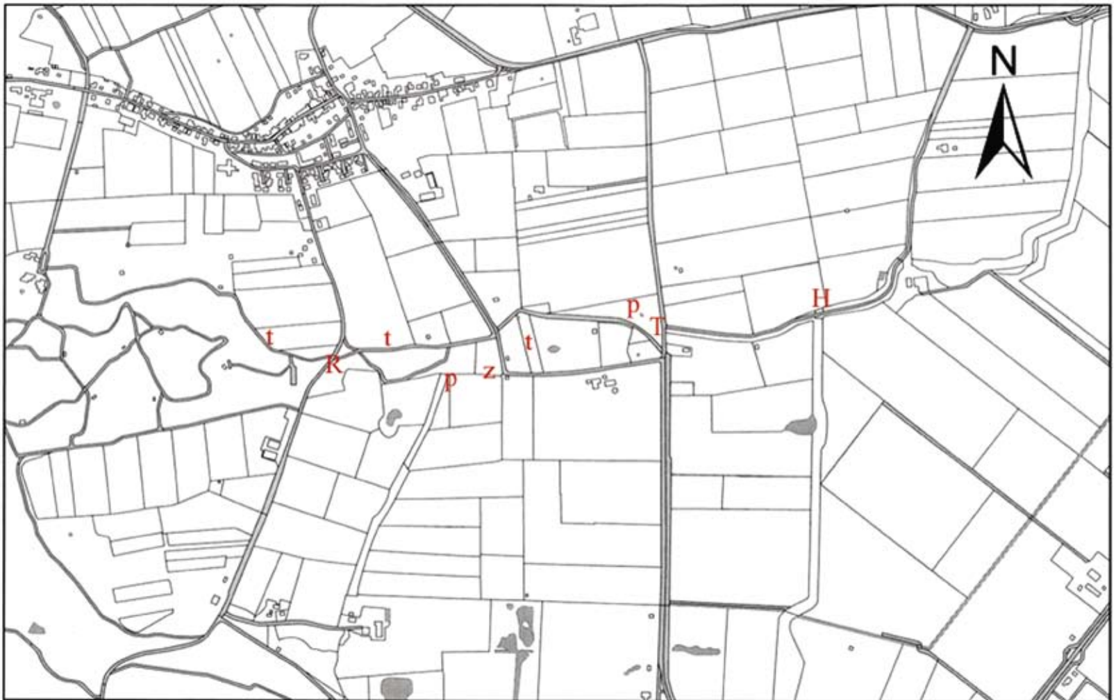
Kaart met herstelmaatregelen