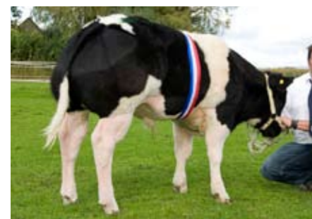
Floris (v. Samourai), kampioen jonge stieren

De publieke belangstelling voor de Nederlandse nationale keuring witblauw was mager. Ook het aantal aanmeldingen was met 87 stuks laag, in aanmerking genomen dat er voor deze editie geen voorselectie was. Van de aan-