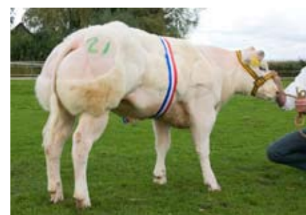
Van het Oudeland Froukje (v. Orme), kampioene jonge vaarzen

meldingen bleek bovendien een aantal dieren afwezig of ze werden geweerd uit de competitie vanwege scheve muilen. Foktechnisch was deze editie een zeer goede leerschool. De twee jurykoppels keurden met strengheid op het beenwerk; overkoting, te rechte spronggewrichten of een moeilijke gang werden consequent afgestraft, ontwikkeling en