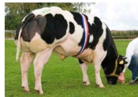
Rowan (v. Germinal), kampioen oudere stieren