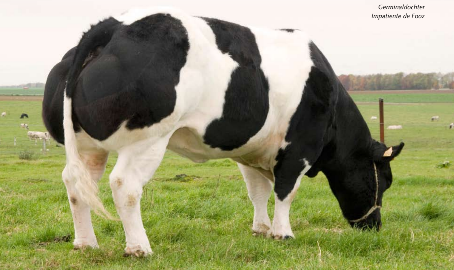
Germinaldochter Impatiente de Fooz

ren en het uitgroeien steeds beter. Ze was groot en lang en had veel macht voorin. Met Lascar probeerde ik weer wat meer finesse erin te fokken.' De combinatie leverde Germinal de Fooz op. 'Al vanaf de geboorte was het een opvallend kalf: hij was sterk en startte meteen erg vlot.'