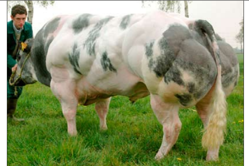
GERMINAL DE FOOZ (LASCAR X AJUSTE)

Jean Ippersiel beaamt het fokkerijplaatje van Germinal en looft vooral de lengte en de breedte die de stier in de volgende generatie kan meegeven. Een kleine opmerking volgt voor het kenmerk drinkkracht met een verwijzing naar de score van 117 voor lange tongen. 'Germinal blijft een uitzonderlijke witblauwstier', vindt Ippersiel. Een verwijzing naar de prestaties in de diverse showrings in Vlaanderen en Wallonië volgt. 'Kijk bijvoorbeeld maar naar de witblauwprijskamp in Libramont afgelopen zomer. Nog nooit wist een witblauwstier zich zo te vestigen zoals Germinal dat daar heeft gedaan. En hij weet zich wel op elke prijskamp te vestigen.' |