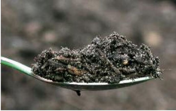
In een theelepeltje grond zitten 10 miljard micro-organismen.