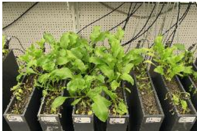
Een toets onder gecontroleerde omstandigheden waarbij de bodemweerbaarheid tegen Rhizoctonia solani wordt bepaald.

Biotische factoren krijgen ook een prominente plek in de set maatregelen. Deze zijn gemakkelijker te beïnvloeden, zegt Van der Wurff. Te denken valt aan een gewasrotatie met groenbemesters en toevoeging van stoffen die bacteriën stimuleren om chitinases te produceren. Dit enzym breekt chitine, een bouwstof van diverse schimmels en aaltjes, af. Een andere veelbelovende mogelijkheid is niet-schadelijke bacteriën stimuleren die met schimmels om hetzelfde voedsel concurreren. Bacteriën eten in het algemeen sneller, waardoor trager groeiende schimmels in het nadeel zijn.