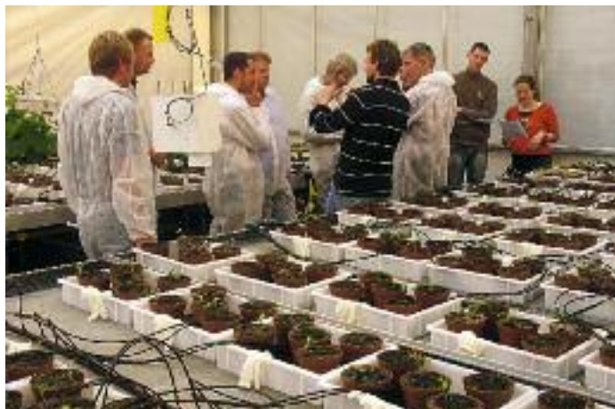
Toets waarbij grond van gangbare chrysantentelers en biologische tomatentelers is getest op weerbaarheid tegen wortelknobbelaaltje, Pythium en Verticillium .

De set praktische maatregelen maakt Van der Wurff onder meer op basis van onderzoek bij gangbare chrysantentelers en biologische tomatentelers. Aan grond van de bedrijven voegde hij wortelknobbelaaltjes toe of ziektekiemen van de schimmels Verticillium en Pythium en wachtte af. ‘Op sommige gronden waren na een tijd vrijwel alle aaltjes verdwenen en op weer andere gronden kregen de schimmels geen kans.’