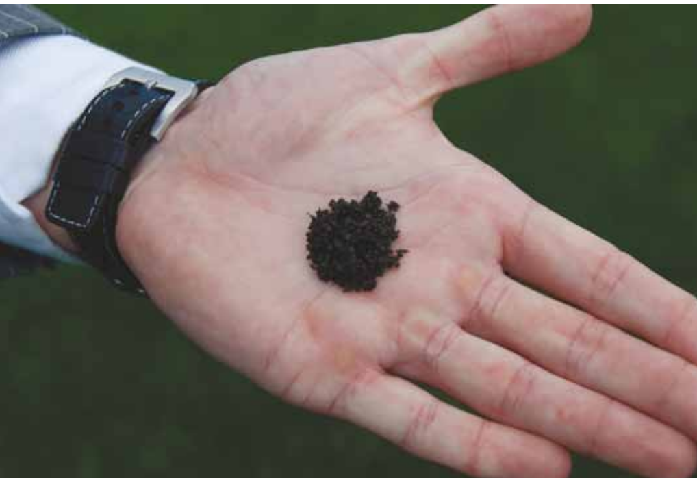
Recticel re-bounce shockpad

Deze combinatie die een Fifa two star-toelating heeft, zou voor meer controle over de bal moeten zorgen en meer comfort voor de speler