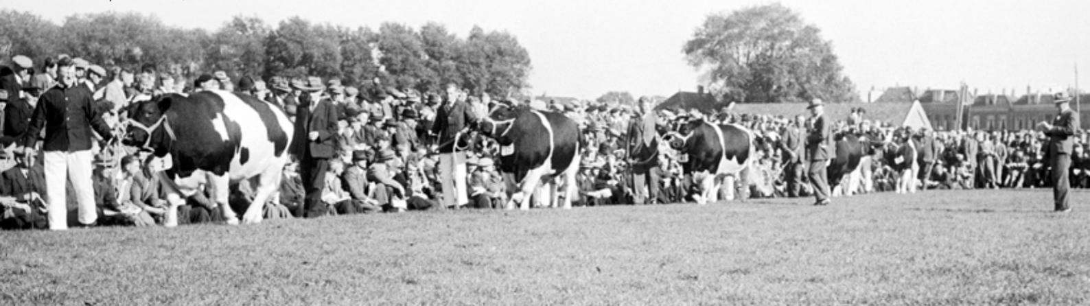
Klaaske 298, 85 punten, moeder van Klaaske's A.A. 16 in 1957 Productie: 5.03 355 11.254 3,70 —