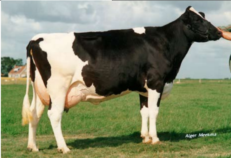
Klaaske 1084, 90 punten (Ovation x Senator), productie: 5.07 370 10.491 3,90 3,11

toe vrijwel geen uitvallers geweest. Het zijn koeien met karakter, ondanks hun geweldige melkproducties blijven de uiers goed, ze staan op prima benen. Het zijn koeien met karakter', zo horen we de praktijkgeluiden.