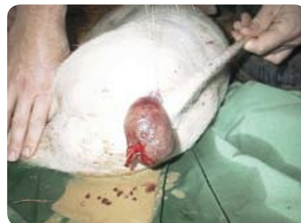
Amputatie anusprolaps big

De preventie bestaat uit het achterhalen en het oplossen van de mogelijke oorzaak. De behandeling bestaat uit het herstellen van de prolaps. Dit lukt meestal bij minder ernstige gevallen. Bij ernstige gevallen kan amputatie van de prolaps toegepast worden. Meestal zijn de vooruitzichten na amputatie slecht.