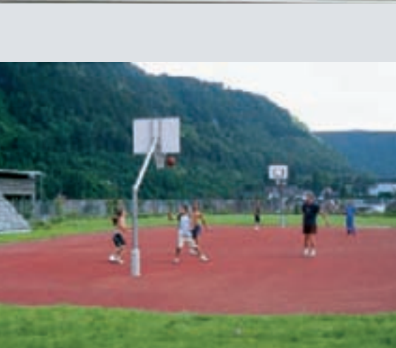
Sinds de opening is het basketbalveld een favoriete plek om elkaar te zien in het weekend.