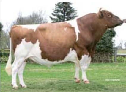
AALSHORST PLEASURE (TALENT X MERTON)

Betr. nvi 75% (cijfers op roodbontbasis) kg m. % v. % e. kg v. kg e. inet nvi lvd. +573 -0,08 +0,03 +19 +23 +76 +145 +491