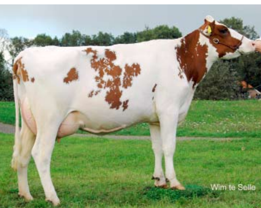
Reina 71 (v. Metallica), kampioene vaarzen Prod.: 2.04 111 3684 3,76 3,05 lw 105