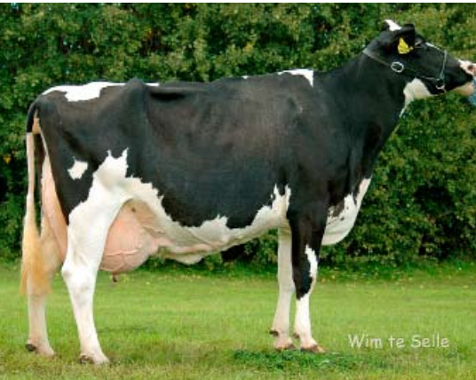
Anja (v. Lee), kampioene oudere koeien Prod. 4 lact.: 28.711 5,27 3,78