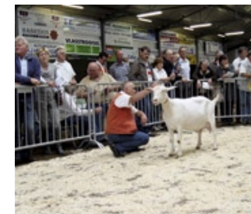
Dringen geblazen om alles te kunnen zien.