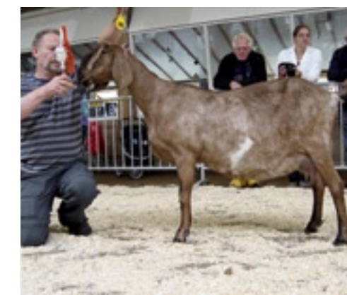
Drie jaar achtereenvolgens de Nubische kampioen.