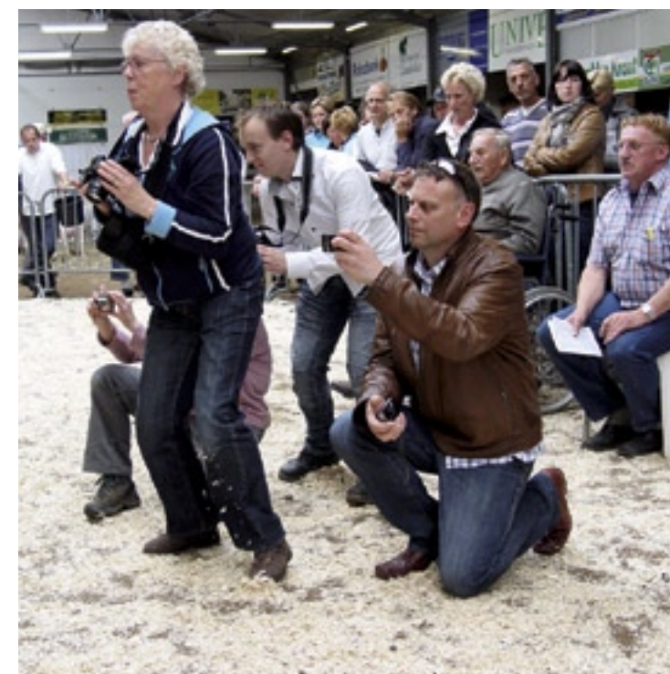
Nationale en internationale belangstelling.