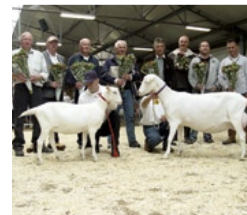
De acht keurmeesters.