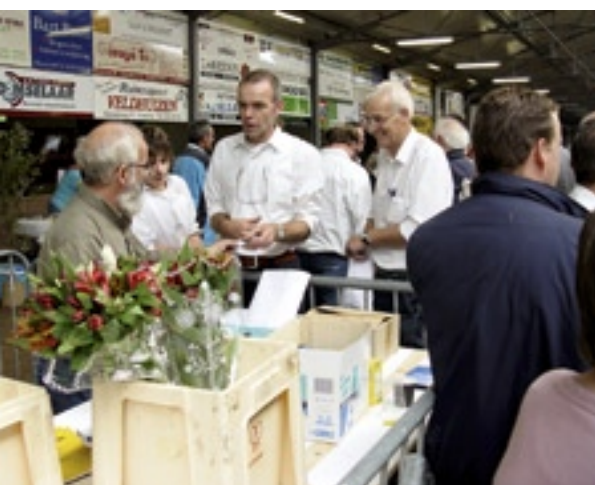
De organisatie had haar handen vol.

Op 18 september werd in manege Voorwaarts in Kootwijkerbroek de landelijke certificaatwaardige keuring gehouden. De organisatie, Stichting Landelijke Geitenkeuring, had de manege prachtig omgetoverd tot een keuringsarena. Ook dit jaar waren er gasten uit Duitsland, België en Engeland. Zij waren na afloop onder de indruk van de kwaliteit van de aanwezige geiten.