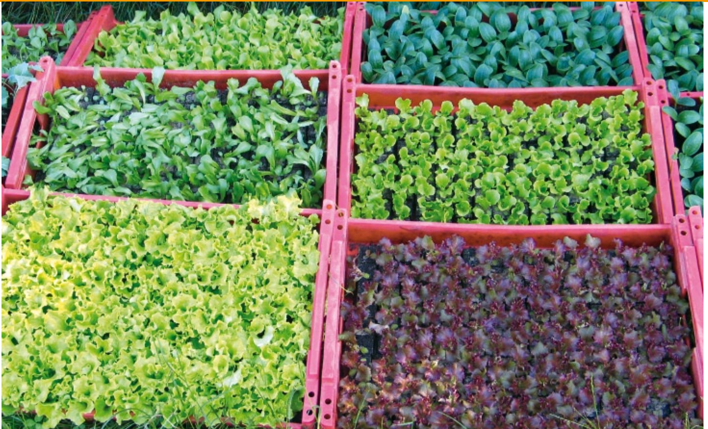
Veel gewassen telen vraagt een uitgekiende planning

belangrijk om een minimale rotatie van 1:6 te hanteren en is ruimer beter.