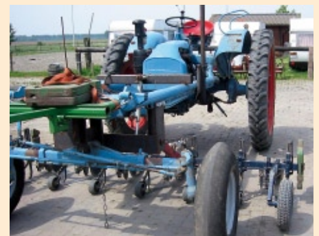
Eicher werktuigdrager met schoffel tussen wielen