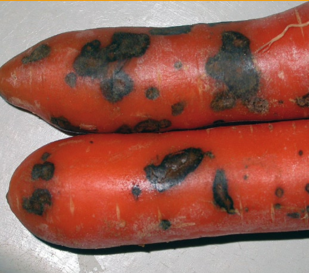
Zwarte vlekkenziekte op peen