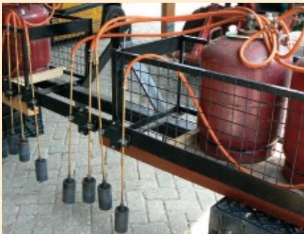
Onkruidbrander voor ruggenteelt

steld dat u zonder veel sleutelen op elk moment kunt rijden. Een aantal rijafstanden kan ook slim worden gecombineerd. Zo kan een schoffelmachine met drie rijen ook gemakkelijk worden ingezet voor pompoenen waarvoor één rij per bed wordt geplant. Een schoffelbalk kan worden aangekleed met anaardmessen, anaardploegen en krabbers. Dit kan de effectiviteit vaak fors verbeteren. Bij grotere oppervlakten kunnen vingerwieders of torsiewieders extra effect sorteren. Een vingerwieder is duurder in aanschaf maar gemakkelijker in gebruik dan een torsiewieder.