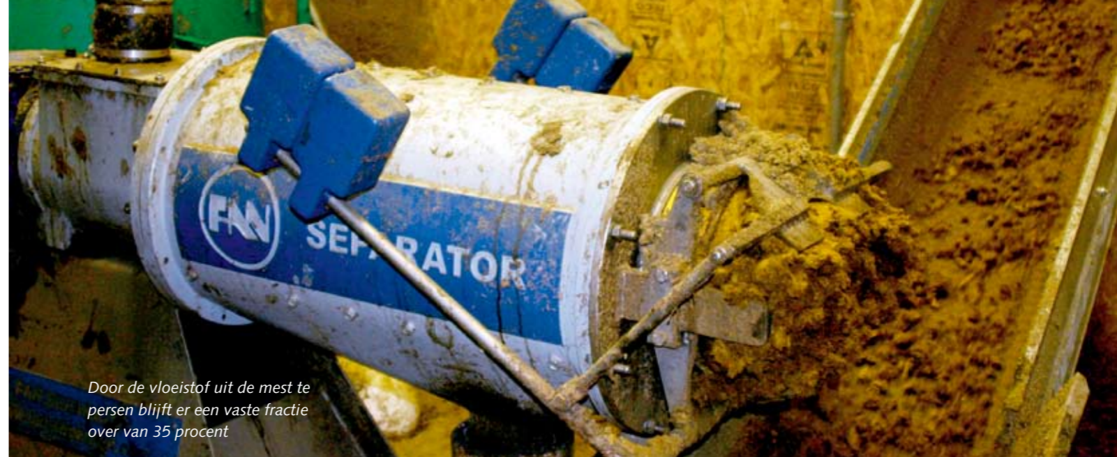
Door de vloeistof uit de mest te persen blijft er een vaste fractie over van 35 procent

zijn, dan kan iedereen het volgen.' Dat geldt ook voor het melken, dat drie keer per dag gebeurt: om 3.00 uur 's nachts, om 10.45 uur en om 18.45 uur. Elke melkbeurt neemt zo'n zes uur in beslag en wordt door drie mensen verzorgd. De melkstal staat nog een paar uur per dag