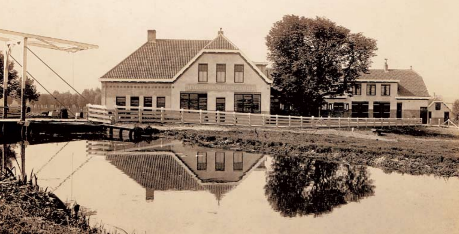
De boerderij aan de Grindweg in Bergschenhoek

zegd. Hij overleed vlak voor de kerstdagen van 1962 op de prachtige boerderij, die intussen ook al is afgebroken.