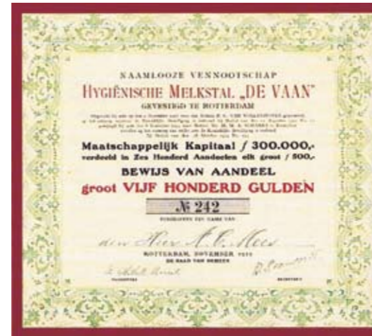
Aandeel van NV 'De Vaan'