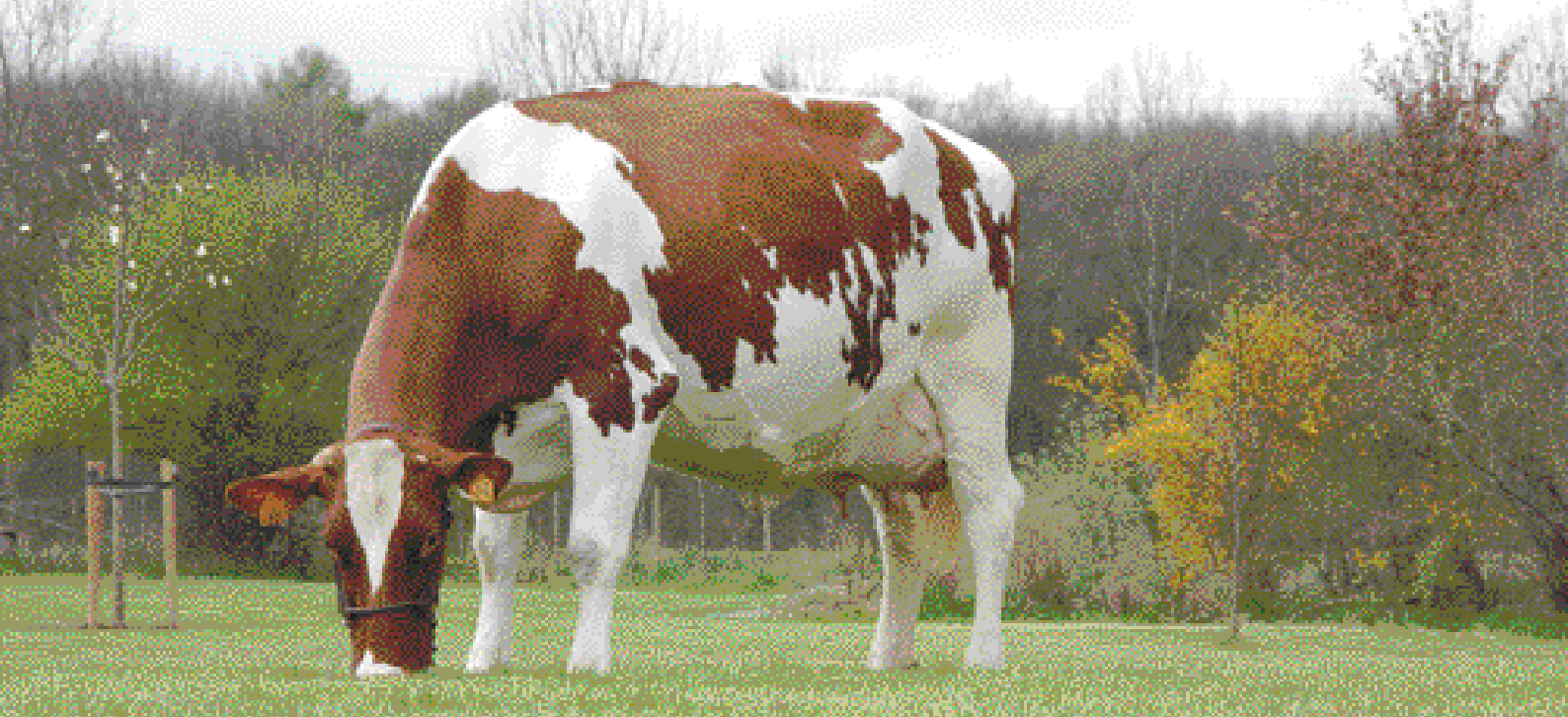
Katrien 300 (v. Ringostar), Productie: 2.01 305 9850 4,33 3,27

De hoogproductieve groep krijgt een rantsoen goed voor 35 kg melk, de laagproductieve groep een rantsoen voor 26 kg melk. 'Omdat het verschil tussen beide rantsoenen erg groot is, stuur ik soms individueel bij als een koe van de ene groep naar de andere overgaat.' Gebruik