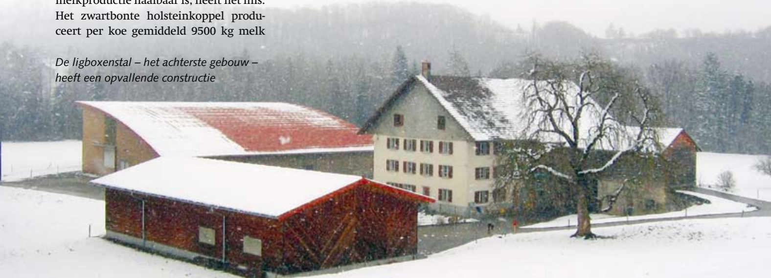
De ligboxenstal – het achterste gebouw – heeft een opvallende constructie

se en Vlaamse veehouderijbedrijven. Het is volgens Roulin een misverstand dat het Alpenland in sterkere mate biologisch produceert: 'Hooguit drie procent boert hier geheel zonder bestrijdingsmiddelen of kunstmest.' Een even klein aandeel van de boeren zet deze hulpbronnen zonder beperking in. De rest boert volgens een tussenvorm, waarbij ten minste zeven procent van het areaal vrij blijft van kunstmest en een even groot deel voor 15 juni niet wordt gemaaid. 'Veehouders krijgen hiervoor via de overheid een vergoeding. Het komt erop neer dat tussen de 25 en 30 procent van het inkomen uit deze bijdrage komt. Daarom is het gemiddelde quotum van de Zwitserse boeren van 120.000 kilogram melk ook toerei-