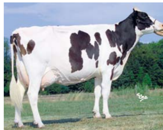
Stiermoeder Lacoste (v. Jolt), 91 punten en in vier lactaties (1501 dagen) goed voor 44.765 kg melk met 4,50% vet en 3,52% eiwit

een zolder boven het melkvee, een ruimte die dienst doet als opslag en voerkeuken. De silo's met krachtvoer (twee soorten: een A-brok en een energierijke brok) en zelfgeteelde, maar elders gedroogde ccm staan er ook. Produceert een koe veertig kilogram melk, dan verstrekt de veehouder zeven kilo krachtvoer, 1,5 kilo ccm en twintig kilo van de mix uit de eigen voerkeuken. 'We kunnen goedkoper produceren, maar ik vind dat je een keer tevreden moet zijn. Op dit moment hebben we weinig problemen met diergezondheid en is de productie per koe hoog. Het is lastig om achteraf hard te maken met welk voer je het meest efficiënt werkt.' Mais en gerst verbouwt Roulin zelf op het 66 hectare tellende areaal. Daarnaast teelt hij tarwe, koolzaad en gras. Francis Terreaux verzorgt de vijftig melkkoeien en neemt de fokkerij voor zijn rekening.