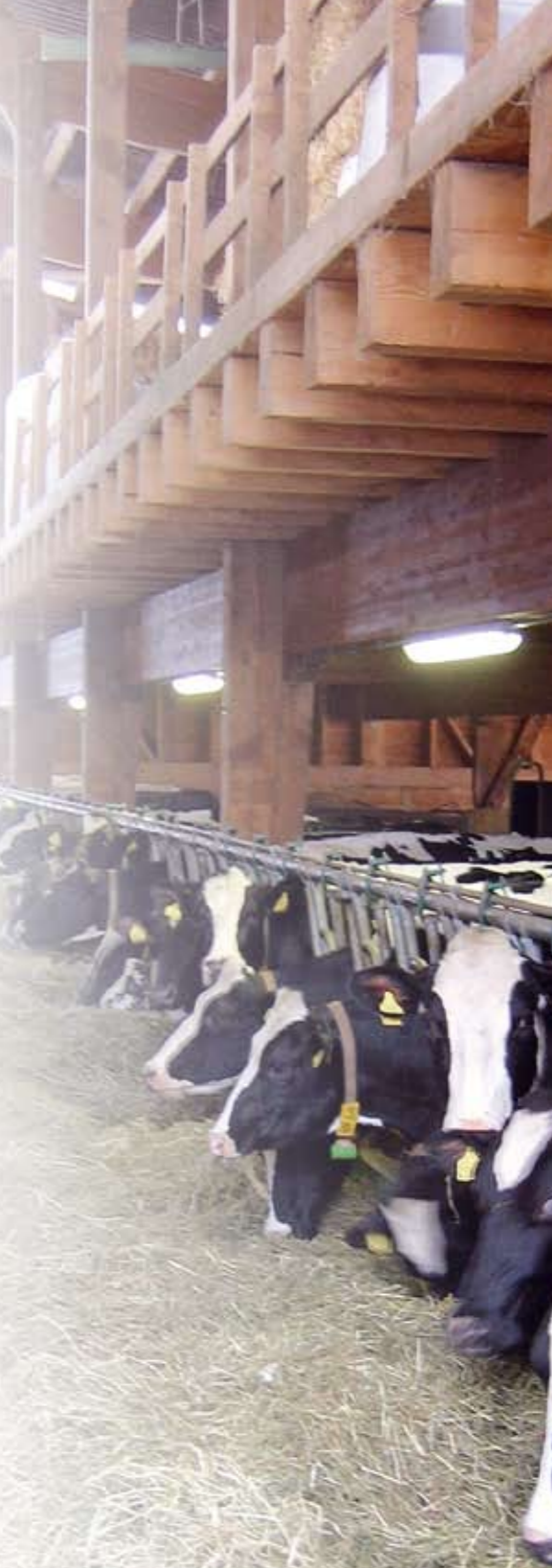
Tegenover het uitgebreide en dus prijziger rantsoen staan volgens Dominique Roulin een betere gezondheid van de veestapel en een hogere melkproductie