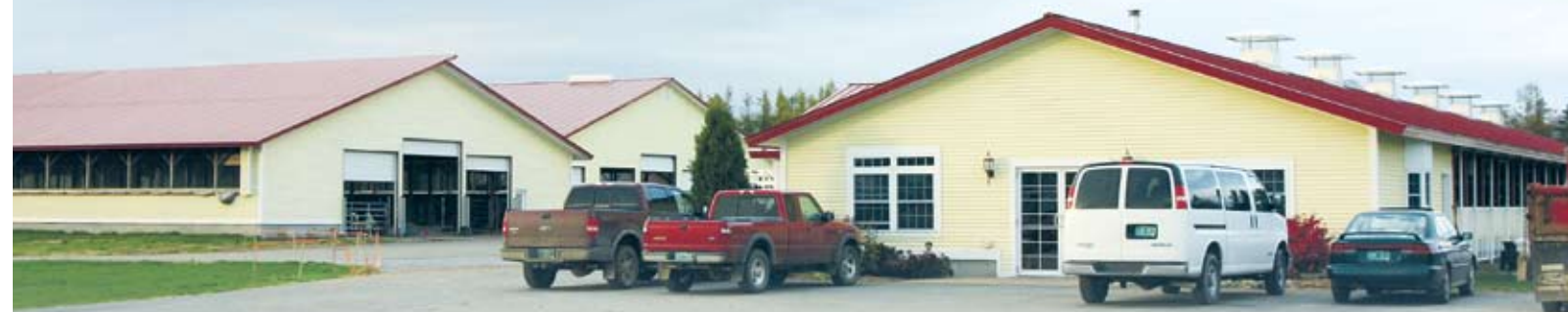
Cowtown: rechts de showstal met elitekoeien, links de stallen voor jongvee

tering verdwijnt. 'Boeren gaan meer melken en het gevolg is lagere prijzen. Dat is voor niemand goed, ook niet voor het dierenwelzijn. We moeten op aanvraag