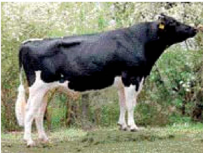
Mascol steekt er met kop en schouders bovenuit

melkplasverer op. Dat veroorzaakt ook zijn forse nvidaling van 66 punten. Importstieren kregen in november nog geen vruchtbaarheidsfokwaarde. Vruchtbaarheid telde daarom voor hen niet mee in de nvi. Nu gebeurt dat wel. Dat heeft tot gevolg dat importstieren met een slechte vruchtbaarheid veelal dalen voor nvi. Behalve voor Jefferson geldt dat bijvoorbeeld ook voor Janosch. De Duitse zwartbontdraai bevat weinig debutanten. Het nieuws komt van stieren die dochters uit de fokperiode aan de melk krijgen. Laudan bijvoorbeeld. De Lukaszoon handhaaft zijn productiecijfers. Halfbroer Lancelot staat niet meer in de Duitse lijst. De Lukaszoon heeft inmiddels een NVO-fokwaarde (zie pagina 41).