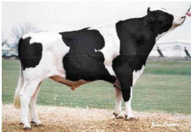
Fokstierdochters bezorgen Amateur nvi-winst

In aantal vrouwelijke nakomelingen is de invloed van de nieuwe nummer twee in de omgerekende nvi-lijst al groot. Bay-Bob Amateur profiteerde van de nieuwe rekenregels omdat hij op alle fronten positieve cijfers behaalt. Amateur heeft inmiddels al 2300 fokstierdochters en is een zoon van Lenzway Tesk Rubytom en Bay-Bob Amanda. Amanda kreeg 88 punten en haar stamboom gaat via