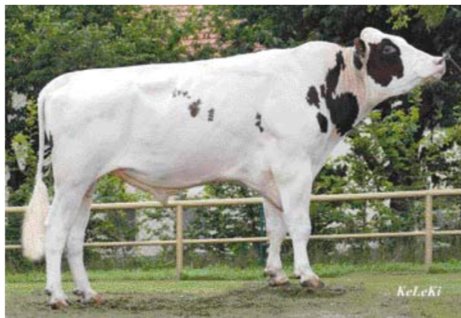
Duitse Starfire uit familie van Jafral Enhancer Jolie