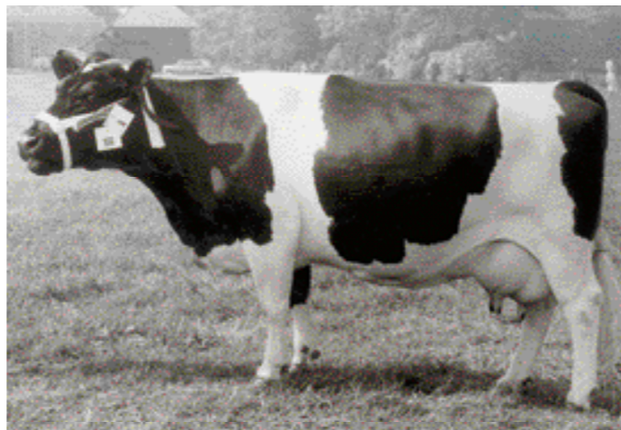
Jaar B 1, 84 punten, res.kampioen e te Leeuwarden en Harenmolen Productie: 5.04 352 6171 4,05 — doorgemolken