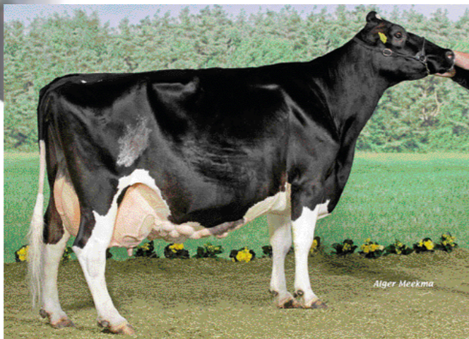
Jaar B 579, A93 punten, veelvoudig kampioene Productie: 7.11 305 12.311 3,88 3,14