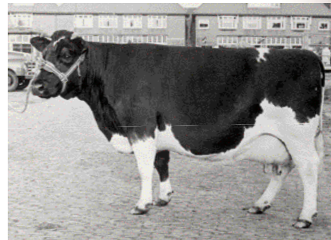
Jaar 17, 84 punten, reservekampioene te Sneek 1952 Productie: 7.02 360 6361 3,95 —