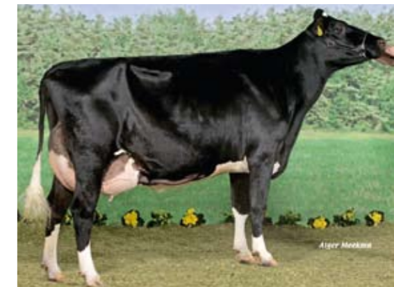
Himster Olga (v. Grandprix), reservekampioene midden Productie: 2.01 305 10.505 3,85 3,20