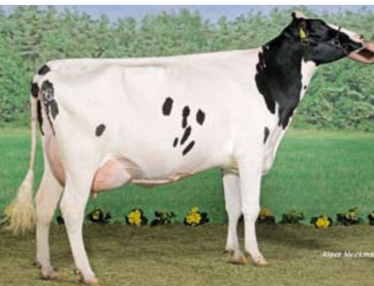
Topcross Anna 149 (v. CB Allen), reservekampioene junioren Productie: 2.05 83 2439 4,49 2,84