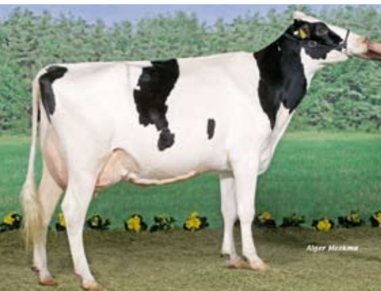
Belgia Feikje 43 (v. Stormatic), juniorenkampioene Productie: 2.01 393 11.145 4,01 3,17

Fokkoe Oslo trekt in Leeuwarden de aandacht met twee kampioenes in de middenklasse