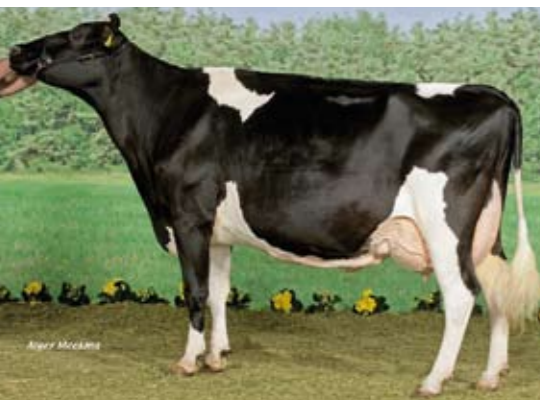
Venetie 2 (v. Emerson), middenkampioene Productie: 2.01 305 9735 3,85 3,35