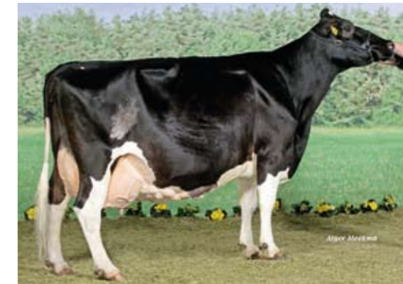
Jaen B 579 (v. Buckval), reservekampioene senioren Productie: 7.11 305 12.311 3,88 3,14