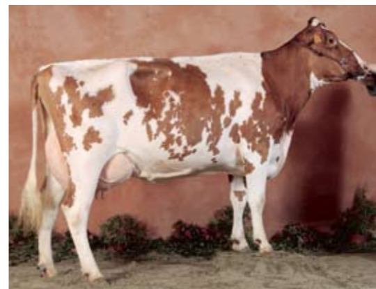
Gemma 993 (v. Sovereign), kampioene oude koeien Productie: 3.05 301 9661 2,61 3,19