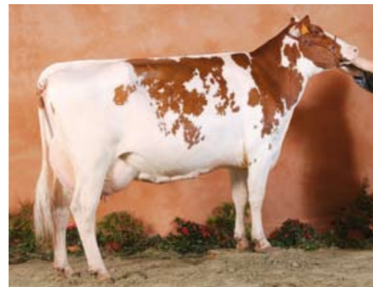
Wlos (v. Stadel), reservekampioene midden Productie: 2.05 305 7978 3,98 3,54