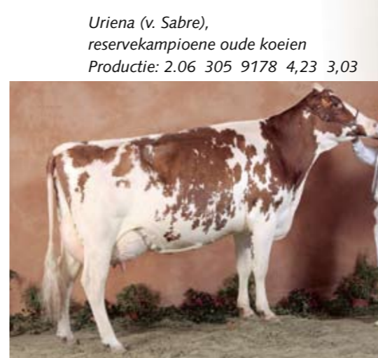
Uriena (v. Sabre), reservekampioene oude koeien Productie: 2.06 305 9178 4,23 3,03

trad Stadelhalfzus Wlos in haar kielzog met de reservetitel.