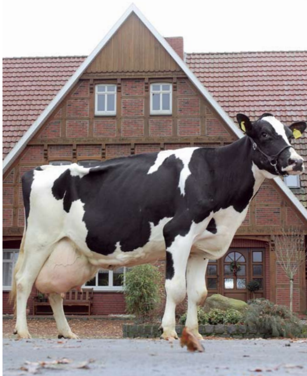
Heldine, kort na haar elfde kalving en levensproductie van 133.000 kg melk

kg melk met 3,78% vet en 3,04% eiwit verder op te voeren.