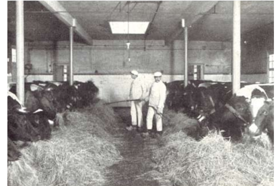
Het ontbrak de koeien aan niets in de modelstal

sching zoo blank, als men zich geen koeiehid, geen koeiesztaarten en geen uiers voor kan stellen.' De verslaggever is bijna lyrisch over de melkstal: 'De tegelvloer, waar de plechtige handeling geschiedt, is zonder vlekje of stofje.' Ten slotte: ook de mededeling dat 'elke arbeider vast eenmaal per week in het bad moet', dat summum van hygiëne haalt de krantenkolommen.