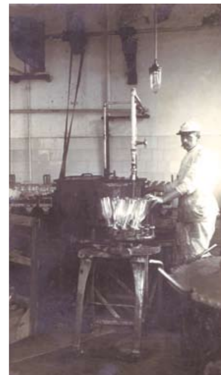
Ook aan de reinheid van de melkflessen werd veel aandacht besteed