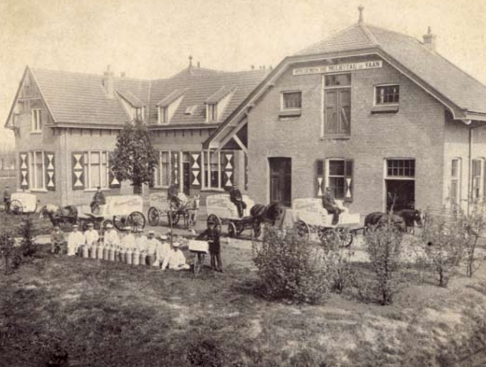
Vanuit de boerderij in Hillegersberg gingen de melkbezorgers de stad in