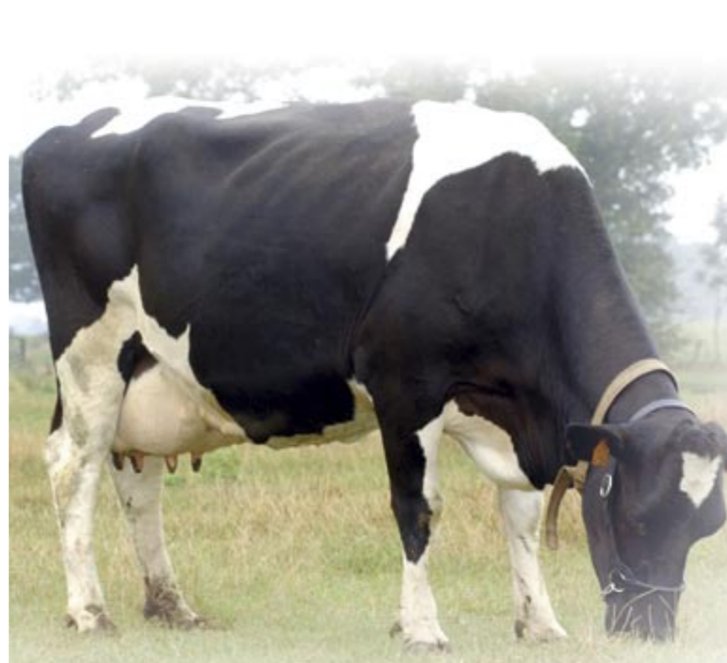
Debbie 24 (v. Folker 62) Productie 2 lactaties: 13.759 3,82 3,62

'Het eerste jaar gebruikte ik een eigen stier omdat we weinig geld hadden en de Franse taal onvoldoende beheersten om contacten te zoeken met ki-organisaties',