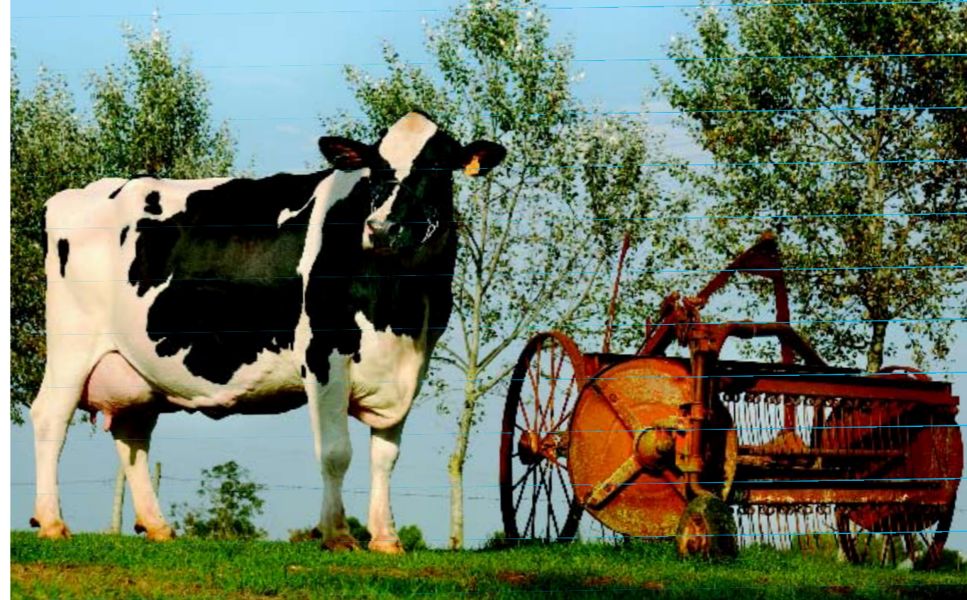
Rianne (v. Fecamp), 90 punten. Tweede lijst: 305 dagenproductie: 11.984 kg 4,33 3,33

Bij de aankoop van het bedrijf 'Le petit Limesle' in 1999 stond een goede verkaveling centraal. 'We wilden een bedrijf dat overzichtelijk was en gebouwen waar we mee verder konden. Daarnaast zochten we een bedrijf met veel quotum omdat uitbreiden in Frankrijk erg lastig is. Het Franse landbouwbeleid houdt schaalvergroting tegen', vertelt Karla. 'Franse boeren zijn snel jaloers, grote melkveehouders worden al snel met de nek aangekeken', weet Ubo.