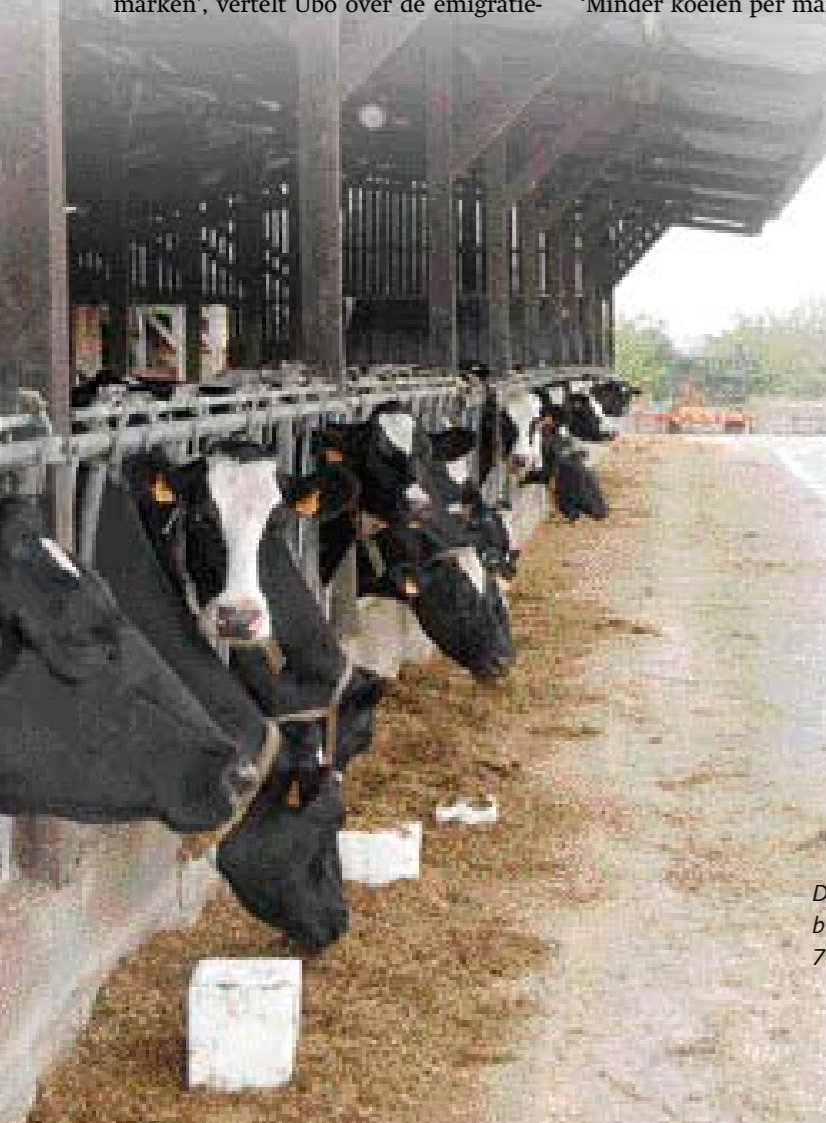
De openfrontstal biedt plaats aan 74 koeien