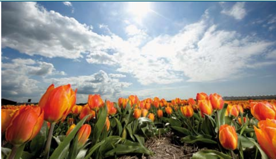
De meeste toeristen komen niet voor bollen en molens, maar voor zee en hei.

Het is voor het toerisme een gemiste kans dat Nederland vooral wordt gepresenteerd als land van polders en tulpen. Nederland kan meer toeristen trekken als het beeld van Nederland veelzijdiger wordt, en promotie zich nadrukkelijker richt op de naaste burens en beter laat zien wat er overal te beleven valt.