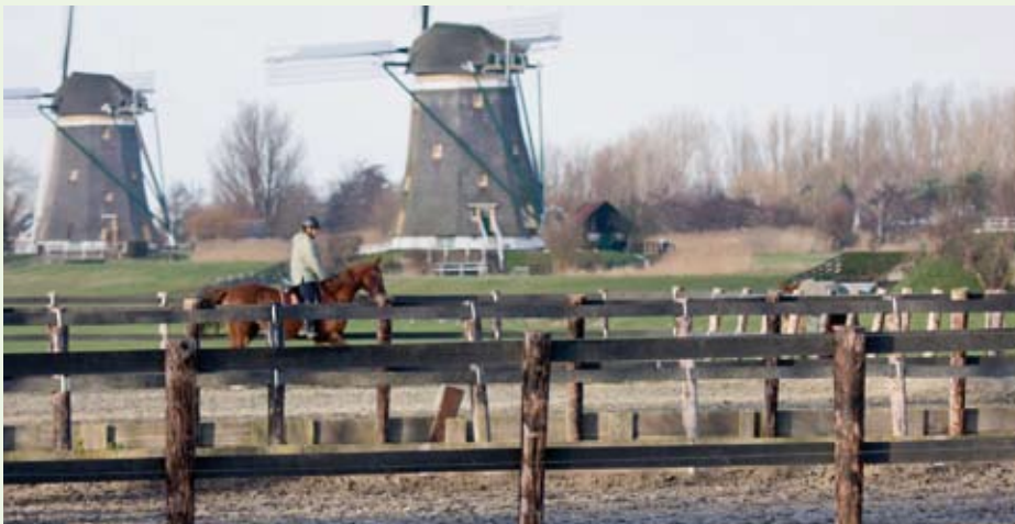
Gemeenten moeten eisen stellen aan hobbypaardenhouders om verrommeling te voorkomen.

Gemeenten hebben nog een blinde vlek voor de hobbymatige paardenhouders, waardoor de kans op verdere verrommeling van het landschap groeit. Dat laat onderzoek van Alterra zien. Alterra adviseert gemeenten daarom contact te leggen met deze paardenhouders, om ze zo te stimuleren om voorzieningen als schuilplekken en lichtmasten landschappelijk in te passen.