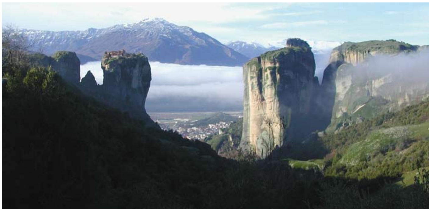
Berglandschap bij Meteora in Griekenland. “Waarom zou Nederland iets te zeggen moeten hebben over het landschap in Griekenland”.