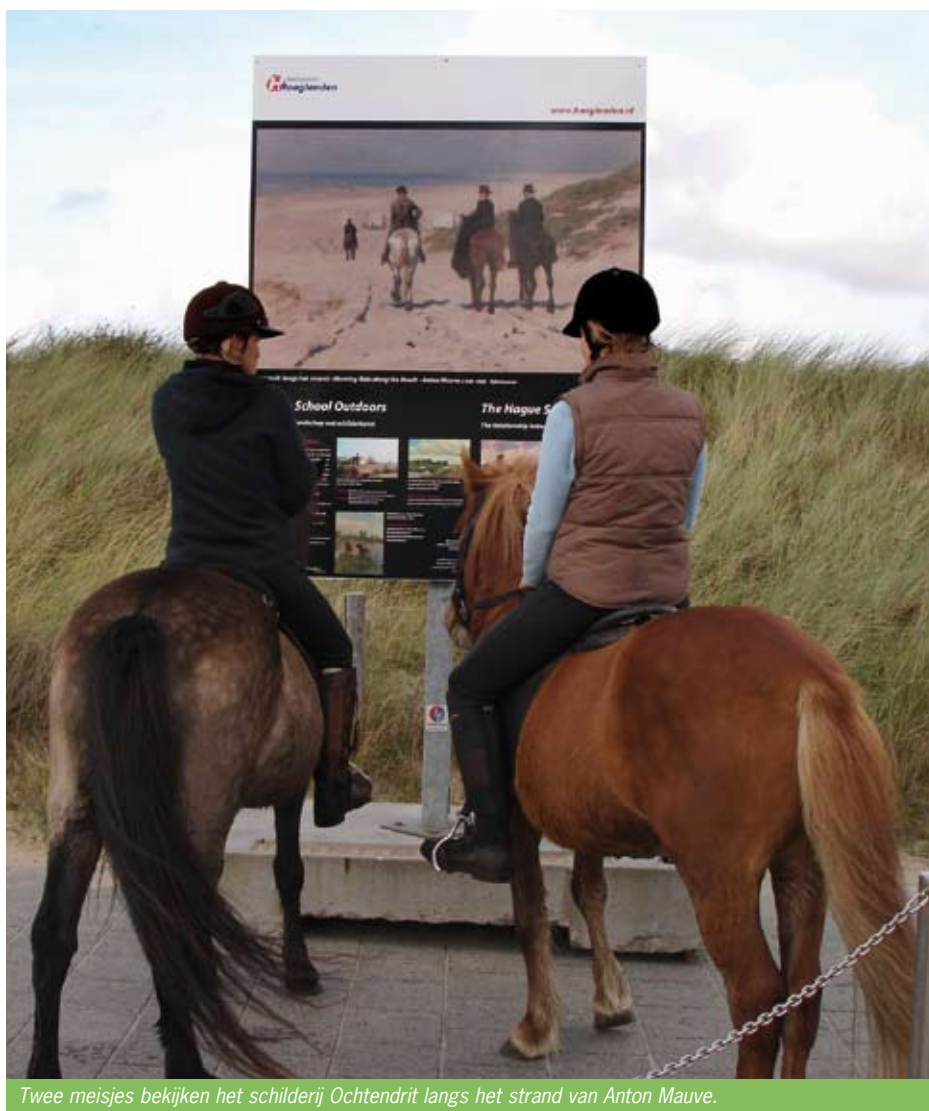
Twee meisjes bekijken het schilderij Ochtendrit langs het strand van Anton Mauve.