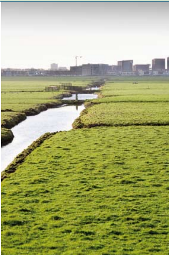
Stadsranden zijn vatbaar voor verrommeling.

Iedereen wil in een mooi land wonen en toch maken we Nederland elk jaar een beetje lelijker. Vooral aan de randen van de steden verrommelt het landschap.