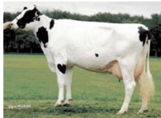
Etazon Vienna (v. Mascot), 88 punten Prod.: 2.01 305 10.764 4,16 3,38 116 lw