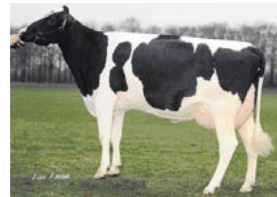
Delta Heart (v. Fatal), 87 punten Prod.: 2.02 305 9737 4,34 106 lw