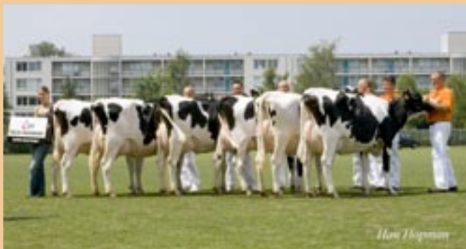
Brede en hoge achteruier voor Paramount

melk uitstraalden, maar blijken gaven van robuustheid. De uierbalans was goed, maar de achteruiers misten hoogte. De ongunstige vet-eiwitverhouding in de melk maakt de Stormzoon niet echt populair in eigen land, maar KI Kampen vond al goede afzetmogelijkheden in het buitenland voor de duurzame en gezond fokkende Stormzoon.