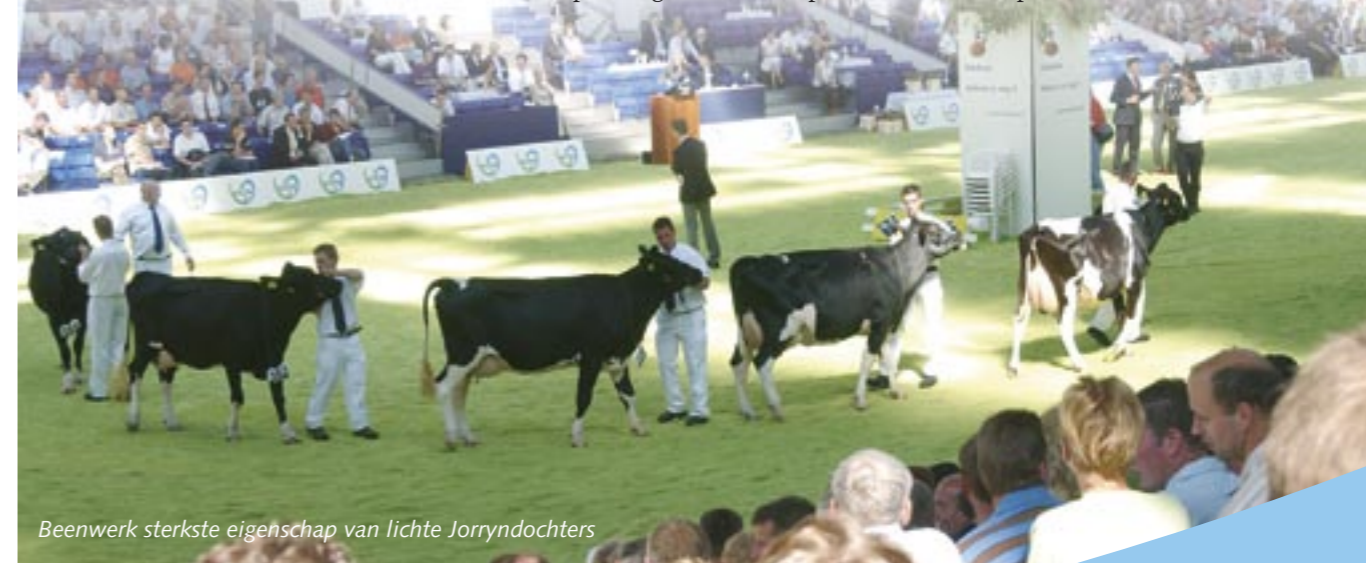
Beenwerk sterkste eigenschap van lichte Jorryndochners