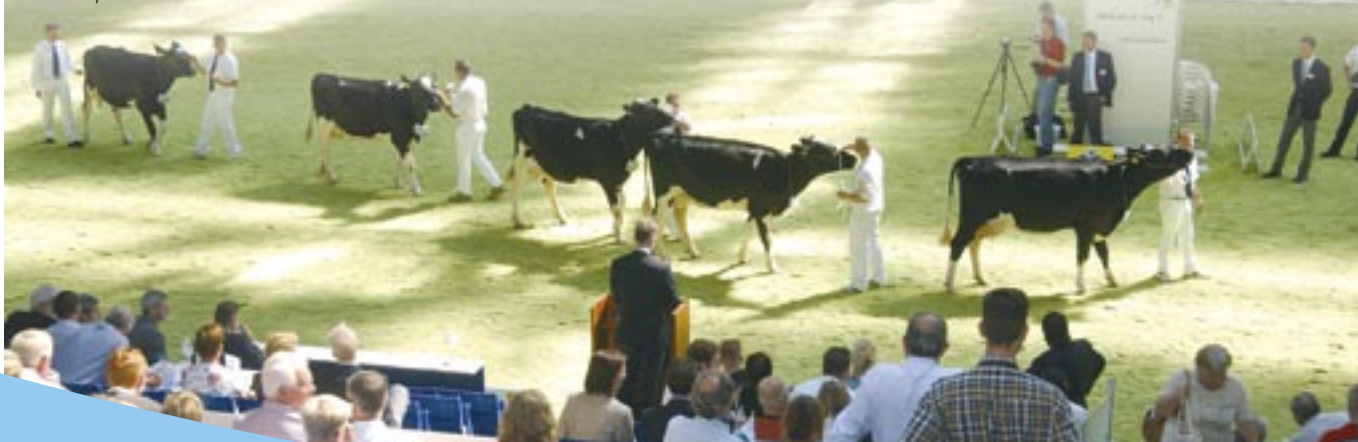
Geen twijfel over het sterke beenwerk van Blackstorm