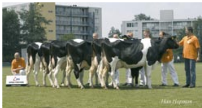
Fortune: malse werkkoeien met jeugd

Ook voor Apina Fortune betekende het een tweede optreden. Fortune weerde zich tijdens de HHH-show in 2005 kranig en zijn almaar stijgende fokwaarden maken hem tot een gewilde stier van HG. Fortune is de Russelbroer van Penotti uit moeder Apina Etazon Anney 3 en stelde zijn gebruikers niet teleur. De malse werkkoeien met jeugd, fraaie overgangen in het skelet en prachtige kruispartijen liepen vlot door de ring. De tweedekalfskoeien hadden zich prima doorontwikkeld en de brede, hoge achteruier sprak tot de verbeelding. In beenwerk telde vooral de kracht van de stap en de hoogte van de klauw. Het is inmiddels een vaak genoemde term, maar Fortune lijkt toch echt