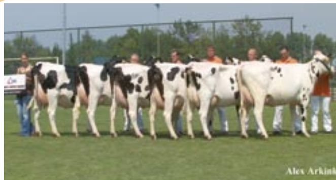
Ramondochters sterk in frame en achteruiers

Van Alta's verkoopkanon Lucky Mike waren de proefstierdochters aan het eind van de derde lactatie en de NRM kwam voor deelname van fokstierdochters een halfjaar te vroeg. De Lucky Leozoon viel daarom 'tussen wal en het schip' volgens Alta, zodat ervoor gekozen werd om voor de tweede maal dochters van Frankenhof Accoord te presenteren. Aaronzoon Accoord – met 114 ook al zo'n benenspecialist – werd eerder al getoond tijdens de Alta Dairy Day in Zeewolde en liet nu oudmelkte vaarzen en verse tweedekalfskoeien zien. Zijn destijds pas afgekalfde vaarzen waren uitgezwaard tot sympathieke koeien. Dankzij de royale hoogtemaat en de diepte en lengte in het skelet schaarde Accoord zich tussen de leveranciers van showkoeien. Het lactatiestadium zorgde voor variatie in conditie en uiervulling in de groep, maar eenmaal los in de ring maakten de dieren indruk met de gerektheid van het skelet en de parallel geplaatste, droge benen.