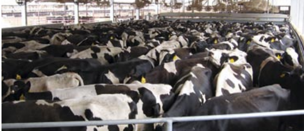
Koeien worden voor het melken in de wachtruimte gewassen

Ondanks de afstand werken de beide bedrijven nauw samen bij de jongveeopfok.