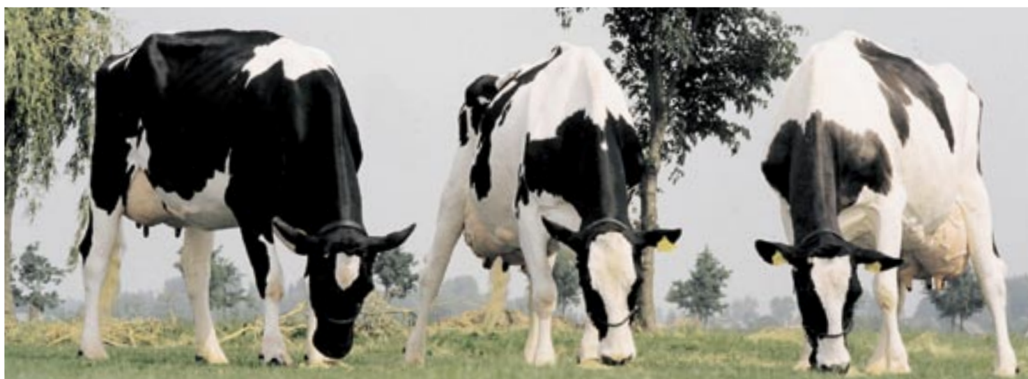
Stammoeder Rita 52 (F16) was met Sunny Boydochter Rita 221 (midden) en Lord Lilykleindochter Rita 233A (links) op de NRM 2000

In de jongste indexdraai solliciteren niet minder dan drie debutanten van de Willem's-Hoeve naar een fokstierstatus. Twee Manatzonen van Rita 233A, Ramstronng en Applause, profileren zich naar moeders voorbeeld als exterieurspecialist, terwijl Ramon (v. Manat) meer neigt naar het productievlak. HG presenteert tijdens deze NRM een dochtergroep van Ramon.