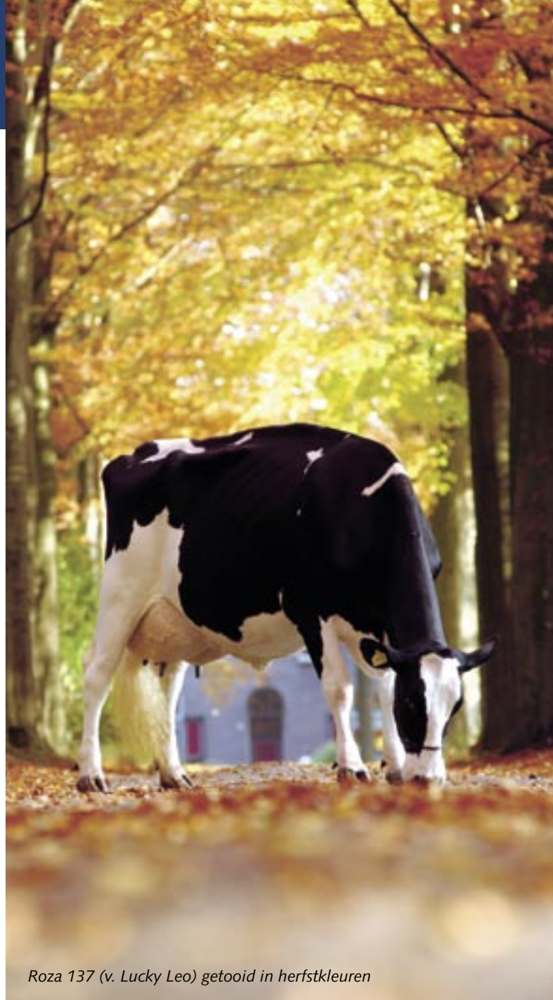
Roza 137 (v. Lucky Leo) getooid in herfstkleuren

Roza 150 maakt in 2002 haar opwachting op de NRM. De Convincerdochter van Roza 121 moet genoegen nemen met een 1c-plaats, maar grijpt een half jaar later de reservetitel junioren op de HHH-show. Een kunstje dat ze twee jaar later herhaalt in de middenklasse. Deze NRM vertegenwoordigen Roza 208, Roza 198, Roza 7014 en Roza 189 de koefamilie.