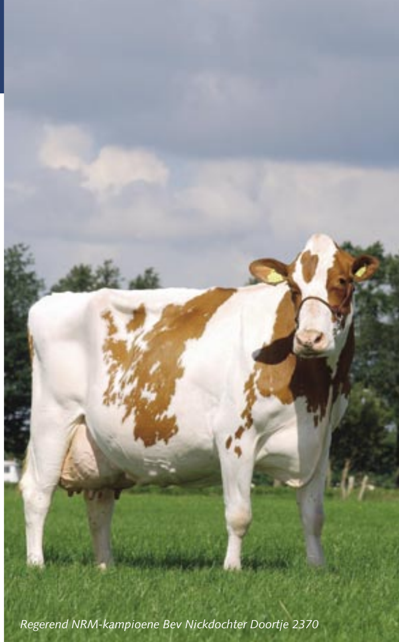
Regerend NRM-kampioene Bev Nickdochter Doortje 2370

Een fokstier is het enige wat de robuuste Doortjes nog ontbreekt, de combinatie van hoog eiwit met sterk exterieur ten spijt. Zo staat de Bev Nick op dit moment voorspeld op 12.500 kg melk met 3,85% eiwit, goed voor 125 lactatiewaarde.