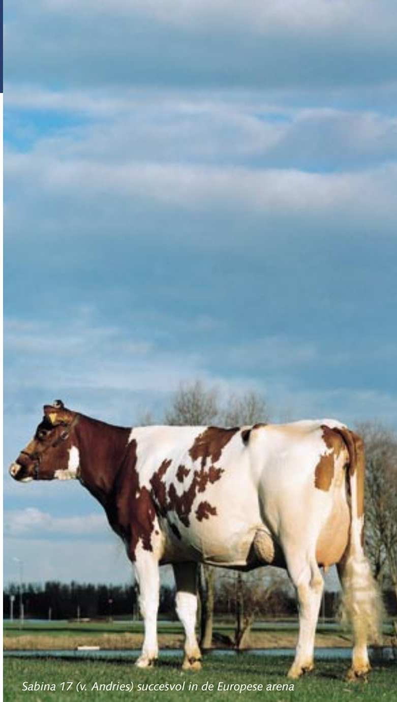
Sabina 17 (v. Andries) succesvol in de Europese arena