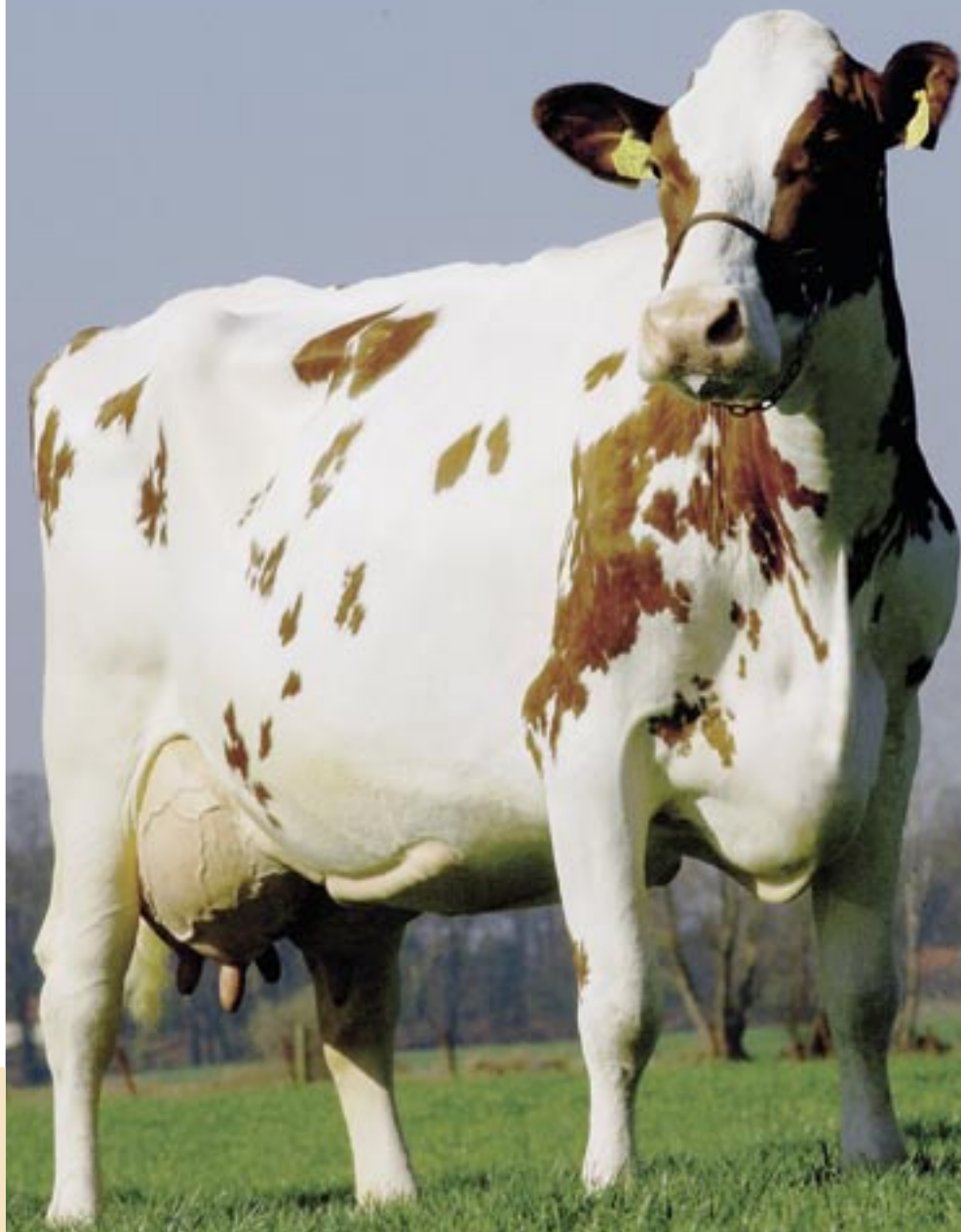
Florina uit familie met functioneel exterieur en goede productie

Vier generaties lang levert de familie al KI-stieren, waarvan de nieuwe DPS-koploper Lowlands Fabian (v. Creylo) in mei 2006 tot fokstier promoveerde. HG demonstreert deze NRM een dochtergroep van Fabian. Zijn excellente moeder Flora (v. Tulip) herhaalt deze NRM het trucje van Florina; ook zij is aanwezig bij een dochtergroepdemonstratie van haar zoon. Flora heeft vooralsnog de meeste showallure. In 2002 vertegenwoordigde ze de familie voor het eerst op een NRM en januari 2006 veroverde ze op de Koe-Expo in Zwolle een 1a-plaats. Flora's dochter Fatima boekte in 2005 op de fokdag van Bathmen-Laren succes.