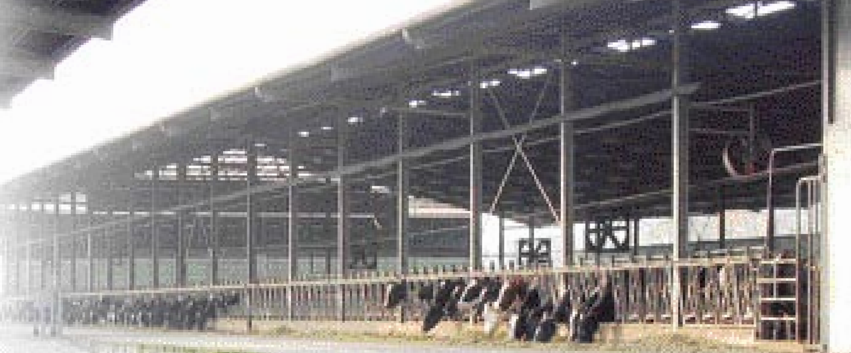
De moderne ligboxenstal biedt plaats aan bijna vijfhonderd melkkoeien

Om de gehalten te verbeteren kreeg een stier als Olmo Prelude Tugolo de nodige kansen. Dat pakte goed uit. Niet alleen uit productief oogpunt, maar ook omdat de Gozzini's met Tugolo tal van foktechnisch interessante dieren fokten. Zoals bijvoorbeeld Go-Farm Tugolo Silver, ingeschreven met 86 punten en moeder van vijf KI-stieren in opleiding. Van Silver loopt er inmiddels een dochter in Nederland. Fokveehandelaar Jan de Vries kocht Silvers veelbelovende Stormaticdochter Go-Farm Sofia, ingeschreven met 87 punten en met een voorspelde vaarzenlijst van 9831 kg melk met 4,19% vet en 3,45% eiwit.